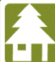
realizzazione grafica Dario Ferroni

CENTRO EDUCAZIONE NATURALISTICA VALLORCH