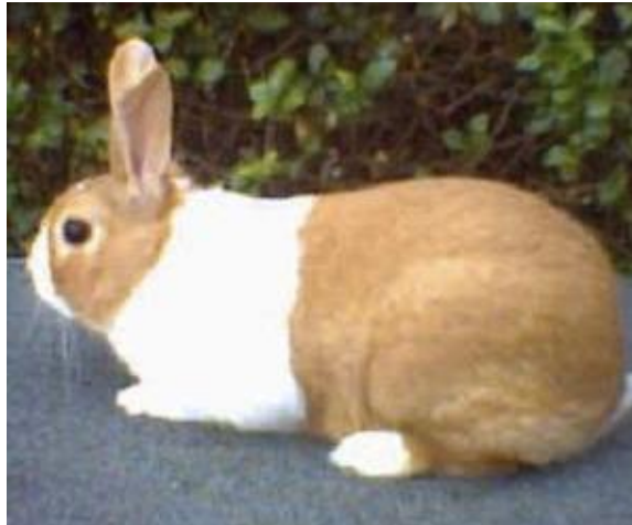
Coniglio di taglia media a pelo raso, bicolore pezzato regolare (tipo olandese), orecchie medie con portamento eretto (razza Olandese)