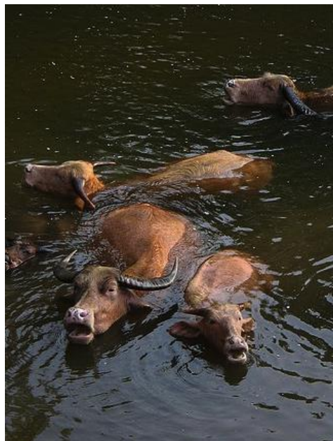
Bufali swamp a mantello rosso e musello depigmentato (rosa)

Il parametro relativo al mantello, pur rivestendo grande importanza, non sempre diventa determinante in questa specie: esistono razze con mantello prevalente e con eccezioni più o meno tollerate (parziale albinismo, pezzature alla testa, etc.).