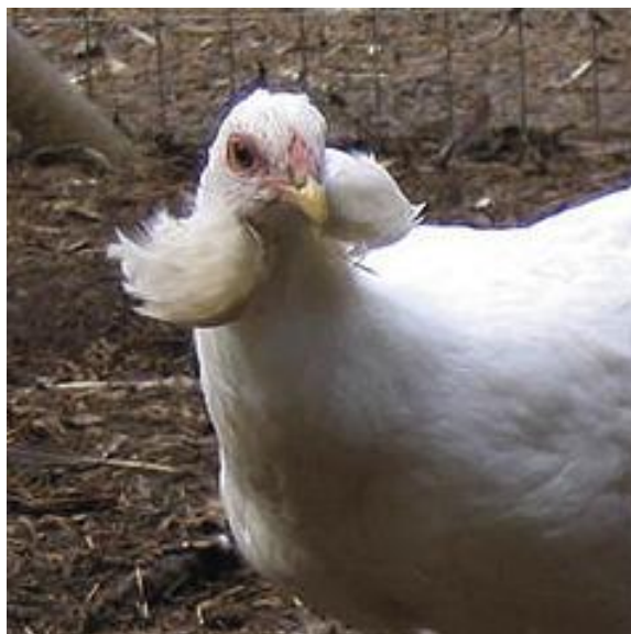
Gallina con livrea monocolore, cresta a rosa, ciuffi auricolari (razza Araucana)