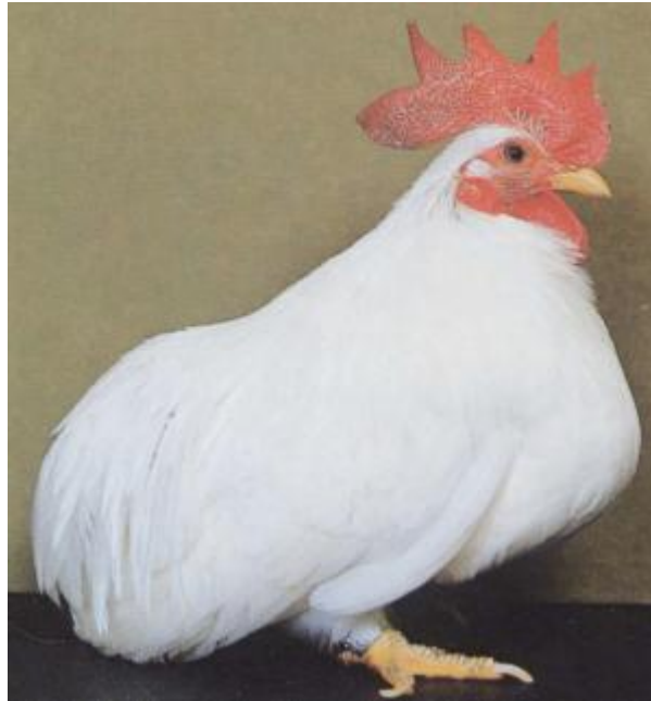
Gallo nano autentico, tarsi corti, monocolore, assenza di vertebre coccigee, cresta semplice grande, orecchioni rossi, tarsi gialli (razza Chabo)