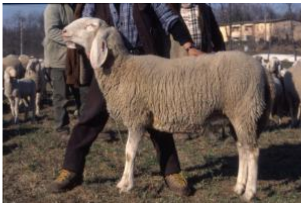
Pecora di ceppo alpino, taglia grande, mantello monocolore, acorne, orecchie grandi e pendenti, (razza Biellese)

Negli ovini l'identificazione del ceppo è di difficile esecuzione. Spesso, alcune razze sono frutto di unione di diversi ceppi, o richiamano solo in parte i caratteri di questi.