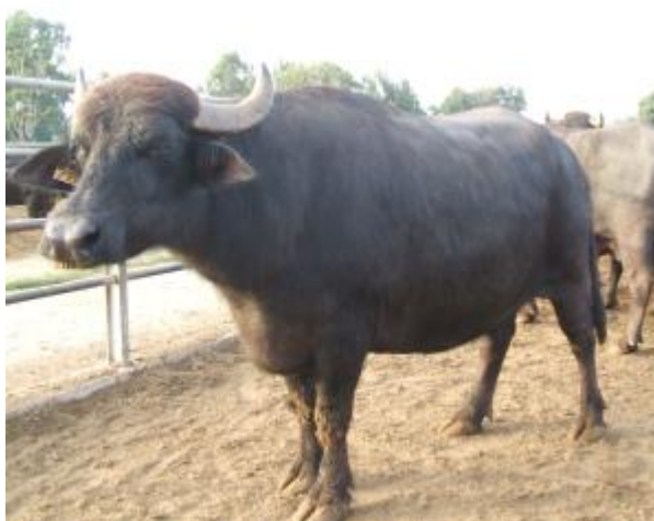
Bufala di ceppo mediterraneo

Nella popolazione bufalina discendente dal bufalo selvatico, si identificano una popolazione (o sottospecie) denominata "Swamp" (Bufalo di palude), localizzata nel sud est asiatico fino alla valle del Fiume Azzurro in Cina e l'Assam in India; e una popolazione presente nel resto dell'India e nelle regioni ad ovest, chiamata "River" (Bufalo di fiume). A questi due tipi potrebbe essere aggiunto, secondo alcuni studiosi, il tipo "Mediterraneo", di cui fa parte la razza Mediterranea