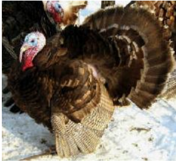
Tacchino con disegno complesso di taglia grande con remiganti barrate (razza Auburn)