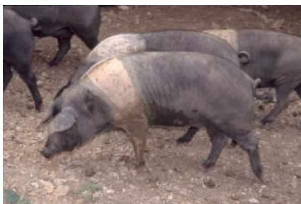
Suino di taglia media, profilo fronto-nasale rettilineo, orecchie medie dirette in avanti, pelo rado, mantello pezzato regolare, cintato (razza Cinta Senese)