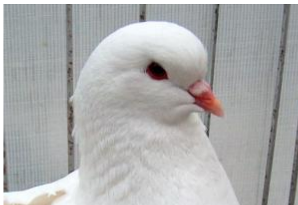
Colombo di taglia grande, con testa a profilo sferico, piumaggio monocolore, becco medio, occhio di vecchia (razza King)