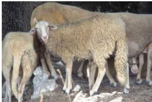
Pecora a vello semiaperto, orecchie orizzontali, coda lunga, assenza di ciuffo frontale (razza Pomarancina)

Di questo descrittore esistono molte variabili, non tutte catalogabili, soprattutto nelle razze asiatiche ed africane (razze "a coda grassa"). Come le capre, esistono ovini "wattle", con sacca adiposa in prossimità della gola.