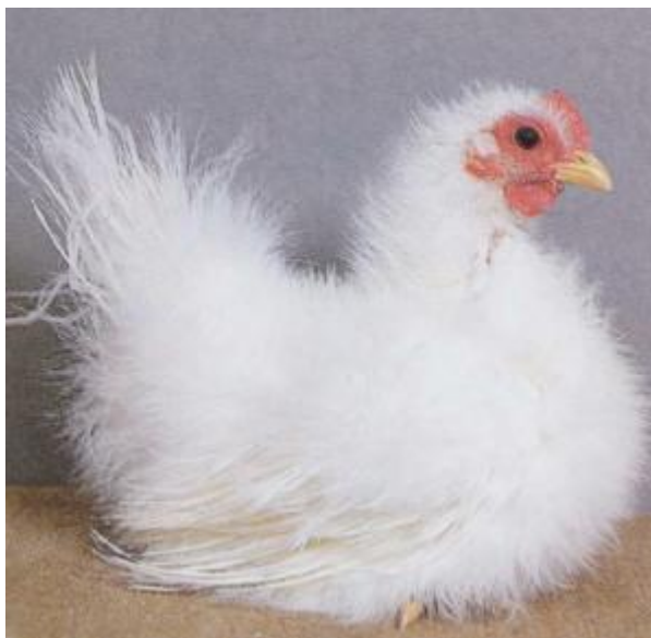
Gallina nana autentica, tarsi corti, piumaggio setoso, orecchione rosso, cresta semplice, piccola ed eretta (razza Chabo)

Il collo nudo può esistere in stato di omozigosi o di eterozigosi. Gli individui omozigoti per tale carattere presentano il collo privo di penne e cute di colore rosso (ad esempio, razza Collo nudo di Transilvania); gli eterozigoti, invece, mostrano la porzione antero-inferiore del collo ricoperta da un ciuffo di penne, mentre la restante parte è nuda (ad esempio, razza Collo nudo di Forez). Per quanto riguarda forma e consistenza delle piume, esistono numerose mutazioni che hanno caratterizzato la nascita di vere e proprie razze, tra cui quelle a piumaggio arricciato (in cui le singole piume seguono una direzione contraria rispetto al normale, facendo assumere all'animale un aspetto arricciato), quelle a piumaggio setoso (dove le barbule delle singole penne non collabiscono, creando l'effetto di piume lanose) e quelle asiatiche in cui le penne di coda e mantellina sono soggette a crescita continua e non mutano mai (Phonix, Jokohama). Stranamente, la domesticità ha eliminato la muta eclissale del gallo, che pur essendo geneticamente dominante non è presente in nessuna razza domestica e si conserva solo nei galli selvatici del genere Gallus .