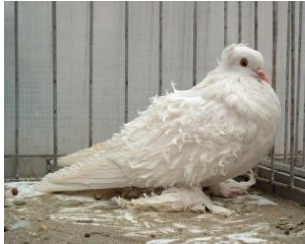
Colombo di taglia media, piumaggio monocolore arricciato, con conchiglia sulla testa, tarsi calzati, occhio di gallo (razza Ricciuto)