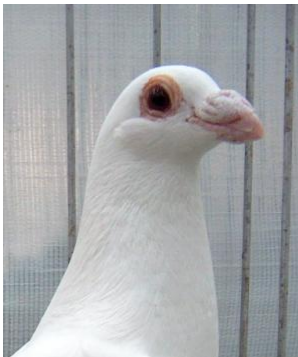
Colombo con caruncola nasale rugosa mediamente sviluppata e caruncole oculari ad anello semplice (razza Dragone)