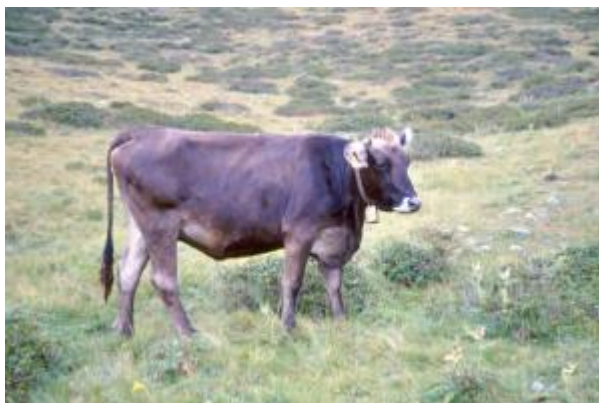
Bovina a mantello uniforme, pelo raso, orecchie grandi, orizzontali a punta arrotondata, musello con orlatura (razza Rendena)

Il musello assume grande rilievo nello standard di razza, ed è un carattere facilmente apprezzabile. Oltre al colore della mucosa, che accompagna spesso il colore della lingua e del palato, si può apprezzare uno sbiadimento del pelo che circonda la mucosa, detta "orlatura". L'orlatura è presente come carattere distintivo di alcune razze, quali la Bruna, la Mucca Pisana, la Rendena, etc.. Il colore e la pigmentazione del musello presentano spesso una spiccata relazione col colore degli unghioni e degli unghielli, nonché con quello della pelle che ricopre prepuzio e vulva.