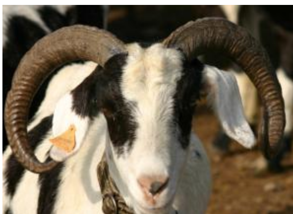
Capra pezzata di ceppo iberico con orecchie semipendenti e corna di forma anomala ("altro") a punte convergenti.