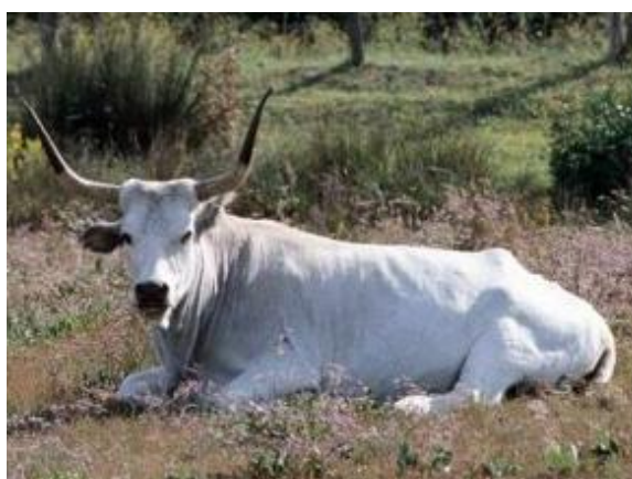
Bovino europeo di ceppo podolico, mantello monocolore a pelo raso, corna a lira grandi e aperte, bicolori con apice nero, musello nero (razza Maremmana)