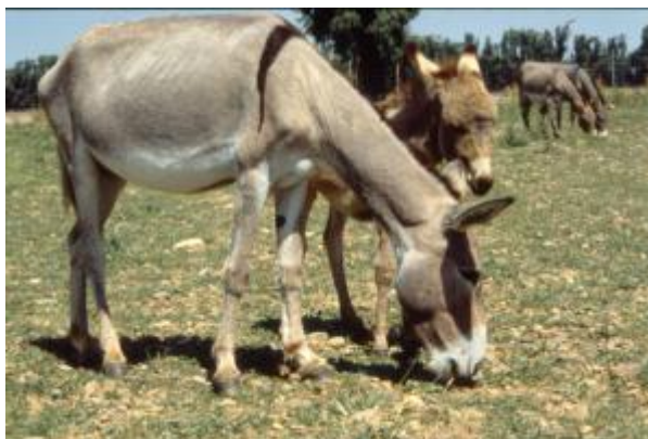
Asino di taglia piccola, con croce (razza Sarda)

Tra le variabili a sede fissa, alcune vengono considerate determinanti per classificare specifici gruppi etnici; quelle relative ad alcune caratteristiche del mantello sono universalmente accettate.