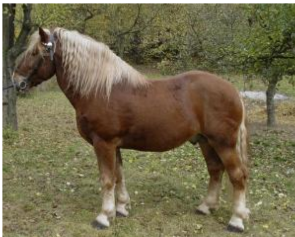
Cavallo di tipo agricolo di taglia grande, con profilo leggermente montonino, mantello bicolore sauro a crine slavato, criniera lunga e peli lunghi alla corona (cavallo Norico)

E' un descrittore fortemente correlato con il "tipo", che ha molta importanza soprattutto per quelle razze che vengono utilizzate per attività anche distanti da quelle caratteristiche del tipo di appartenenza.