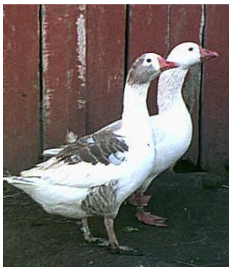
Oca di taglia media a livrea autosessata, maschio monocolore, femmina pezzata, tarsi e becco rosei (razza Shetland)