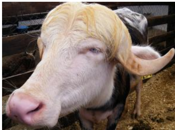
Bufala river, parzialmente albina, con iride e musello depigmentati