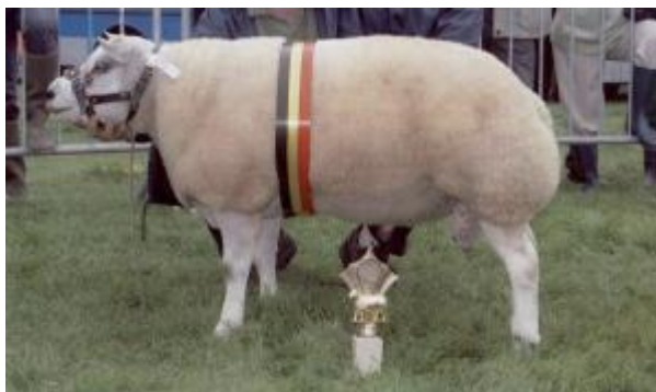
Pecora da carne di taglia grande, orecchie piccole, erette e portate in avanti, profilo fronto-nasale concavo, vello chiuso monocolore (razza Texel)