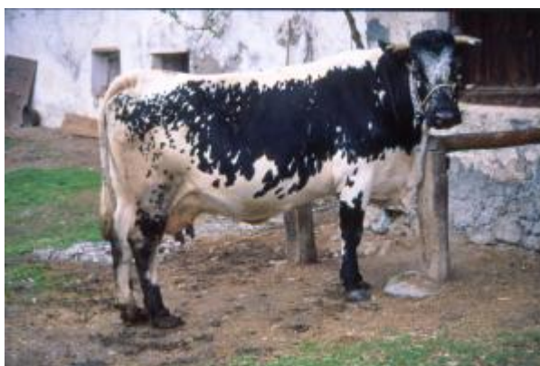
Bovina a mantello spruzzato, a pelo corto e liscio, corna bicolori con punta nera e dirette in avanti, musello nero (razza Pustertaler – Barà)

Il mantello, nella specie bovina, riveste grandissima importanza nell'attribuzione di razza. In linea generale, si può dire che le razze europee ed italiane presentano un alto grado di omogeneità intrarazza nel colore del mantello. Rari sono i casi in cui una razza presenta più mantelli; peraltro, queste razze policrome sono quelle che maggiormente rappresentano il patrimonio autoctono più antico, e non devono a torto essere considerate "non razze" a causa della scarsa uniformità (ad esempio la razza Sarda). Fuori dai confini europei, la presenza di razze bovine policrome si fa via via maggiore quanto più ci si allontana da schemi selettivi codificati. Moltissime razze africane, sud americane ed asiatiche presentano numerosi mantelli all'interno della stessa razza, ed in questo caso rendono il descrittore meno efficiente. Spesso, a mantelli identici e fenotipi simili appartengono razze molto diverse. Il mantello, oltre a rappresentare un importante descrittore, riveste importanza culturale, essendo la sua selezione influenzata da fattori religiosi o simbolici