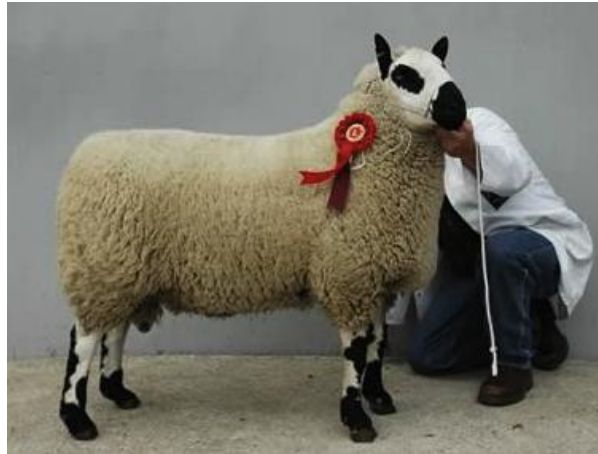
Pecora da carne di taglia grande, vello chiuso pezzato regolare su arti e testa, orecchie erette (razza Kerry Hill)

Le orecchie sono un descrittore molto preciso e di notevole valore etnico. Tuttavia esistono razze con variabilità spiccata di questo carattere.