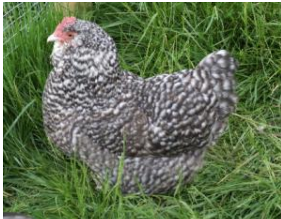
Gallina di taglia media, piumaggio barrato, con barba e favoriti, cresta semplice (razza Faverolles)