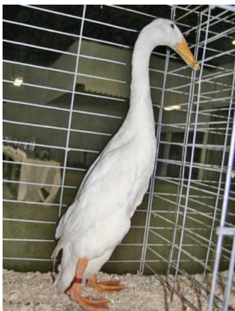
Anatra a portamento eretto, monocolore, becco giallo, zampe arancioni (razza Corritrice indiana)