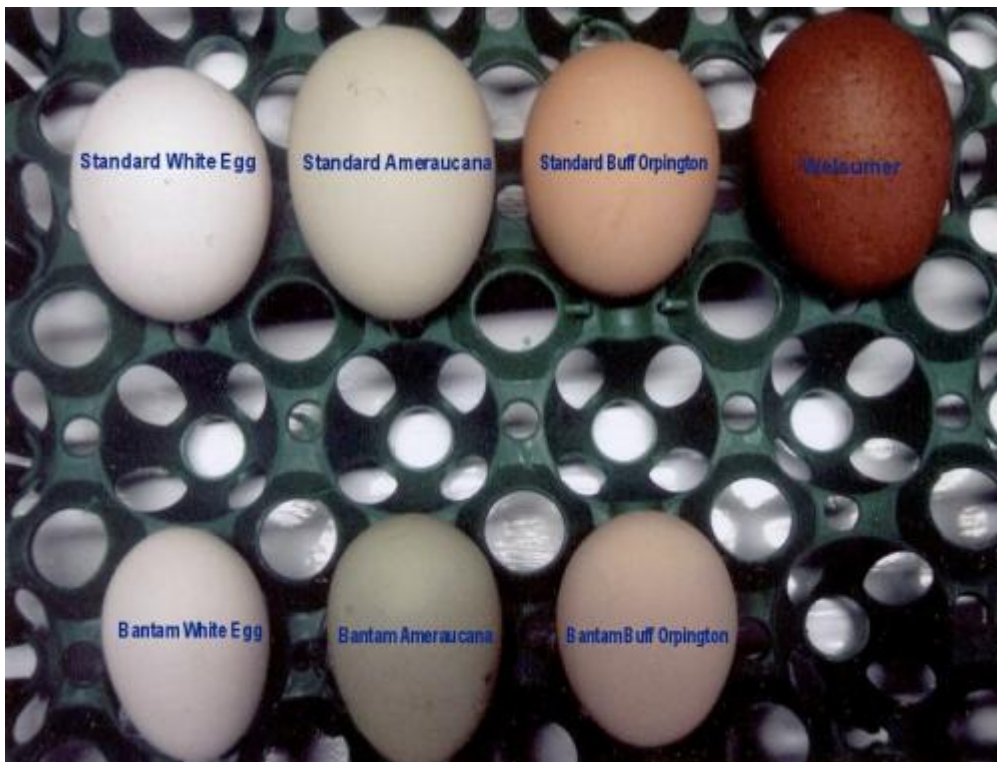
Colore del guscio delle uova in alcune razze

Il colore del guscio dell'uovo è bianco nella generalità delle razze mediterranee, tranne alcune eccezioni, mentre in quelle asiatiche e americane è rosso mattone. La preferenza dei consumatori sud europei per il guscio pigmentato ha indotto gli allevatori ad allevare per lo più ovaiole produttrici di uova colorate.