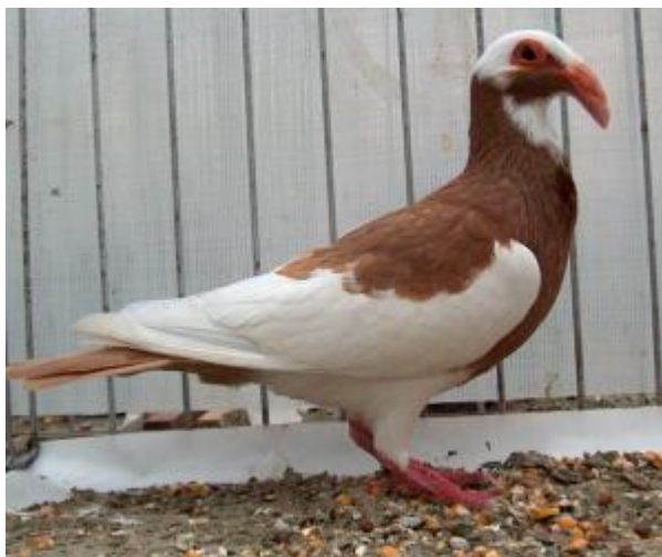
Colombo di taglia grande, bicolore, con becco lungo e arcuato, caruncole oculari semplici (razza Bagadese di Norimberga)