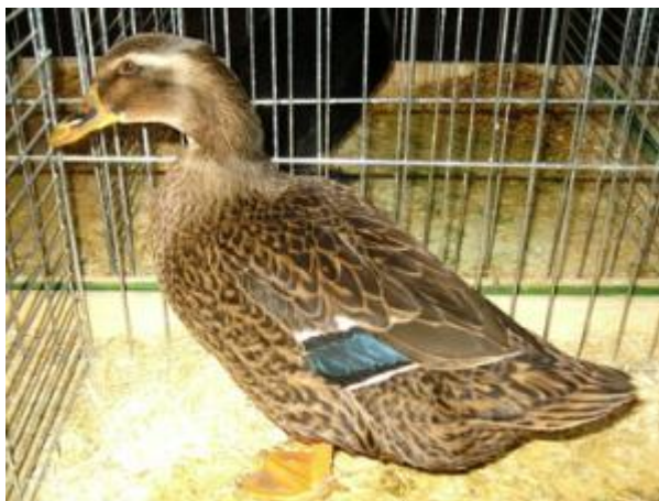
Anatre con portamento inclinato a spiccato dimorfismo sessuale, colorazione selvatica (razza Landenten)