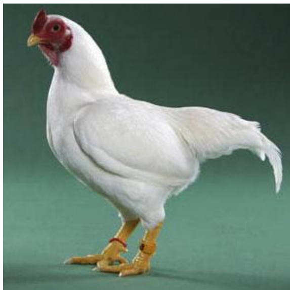
Gallo nano miniatura, tipologia combattente, livrea monocolore, becco giallo, giogaia, cresta a pisello, tarsi gialli (razza Cornish)

Ghigi (1905) ha proposto la seguente classificazione delle razze di pollo sulla base della conformazione corporea: