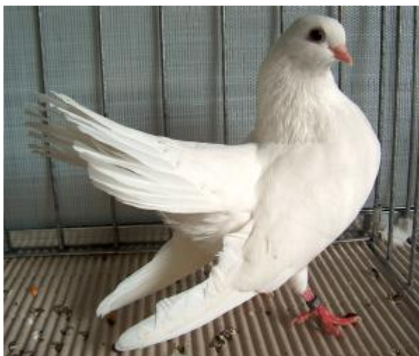
Colombo di taglia piccola, con ali portate sotto la coda, piumaggio monocolore, testa piccola, becco corto (razza Capitombolante di Kazan)

Mentre per alcune razze queste caratteristiche sono etniche, per altre rappresentano difetti morfologici, da eliminare con la selezione