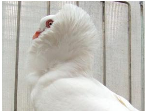
Colombo di taglia media, monocolore, caruncole oculari semplici, occhio di gallo, con cappuccio (razza Cuppuccino Olandese)