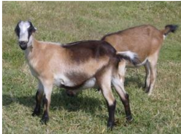
Capra policroma (mantello complesso) con padiglione auricolare ridotto o assente, acorne