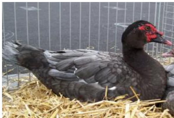
Anatra di Barberia, colorazione blu (Cairina moscata)

Due diverse specie sono state oggetto di domesticazione: il Germano reale in Europa ed in tutte le aree asiatiche, e l'anatra muta o di Barberia in Sud America.