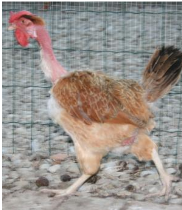
Gallina di taglia media, bargigli espansi, cresta semplice pendente, a collo nudo (razza Collo nudo italiana)

La mutazione pentadattila avviene a carico di alcune tra le più famose razze europee, che sono dotate di un dito sovrannumerario (Dorking). La mutazione “tarsi corti” è tipica di alcune razze (Courtes Pattes, Nagasaki, Chabo); la mutazione “garretti da avvoltoio” è una anomalia anatomica che fa assumere ai polli la postura dell'omonimo uccello, accompagnata da uno sviluppo delle