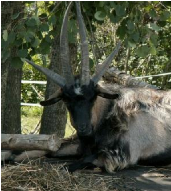
Becco a 4 corna (fenomeno teratologico non letale). Il carattere, interessante dal punto di vista genetico, non riveste importanza etnologica.