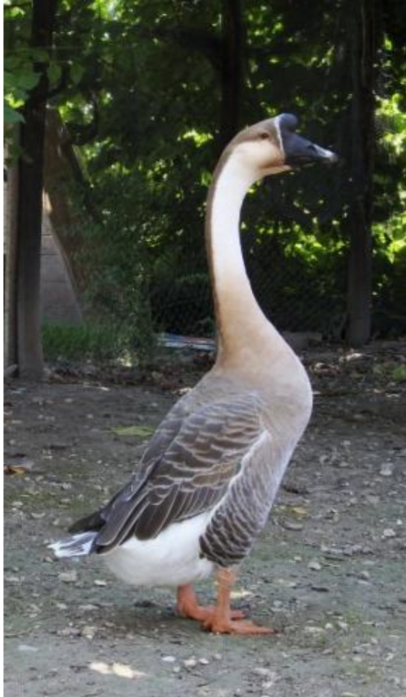
Oca di ceppo cignoide, livrea bicolore, taglia media, portamento eretto, presenza di tubercolo frontale e tratto d'anguilla, becco nero, tarsi aranciati (razza Cinese)

In domesticità, l'oca ha subito un notevole incremento in peso. Le forme sono diventate arrotondate rispetto all'oca selvatica cenerina, e il massimo sviluppo somatico è raggiunto dalla razza francese Tolosa e dalla tedesca Embden. La fertilità di questi animali è però notevolmente diminuita.