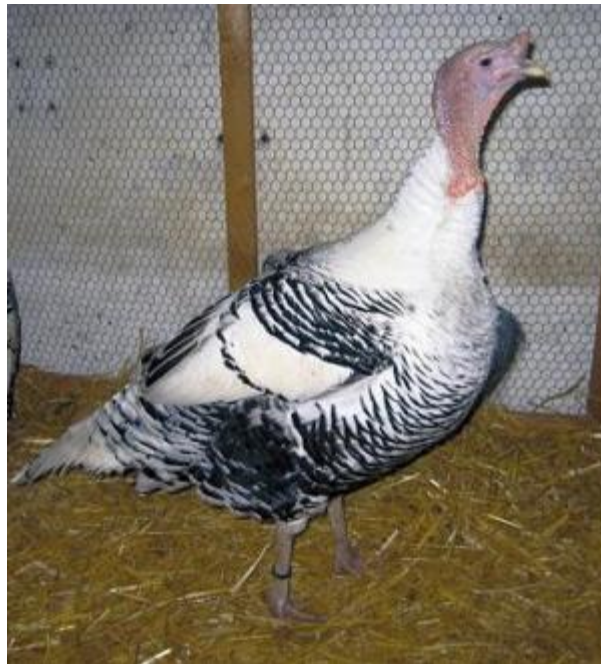
Tacchino bicolore di taglia grande con remiganti non barrate (razza Ermellinato tedesco)

Le livree presenti nel tacchino sono numerose, e nella maggior parte la colorazione identifica la razza, salvo eccezioni ( Ronquieres ). Nel centro del petto, il maschio presenta un fitto pennello di setole nerastre di lunghezza variabile a seconda del ceppo; questo carattere sessuale secondario è però soggetto ad eccezioni in quanto saltuariamente compare anche nelle femmine.