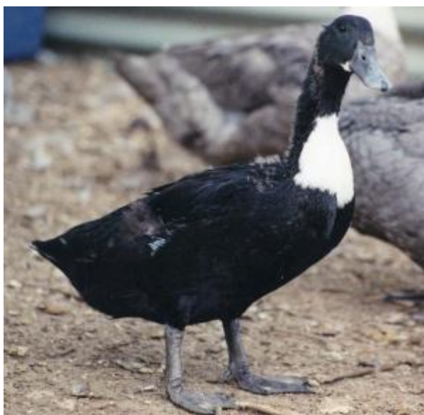
Anatra di taglia media, con portamento inclinato, monocolore con bavetta, zampe e becco scuri (razza Svedese)

Esiste un certo numero di varietà di colore nelle anatre, e molte sono state fissate e standardizzate negli anni. Vi sono razze che si distinguono per un solo colore, mentre altre ne possono presentare innumerevoli in più varietà.