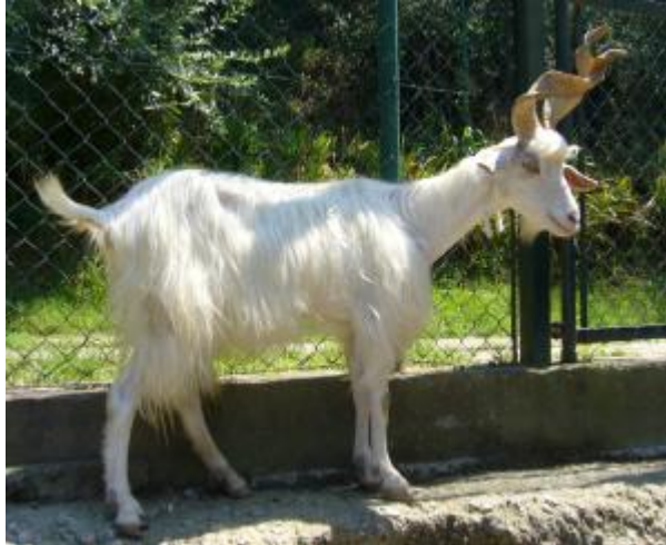
Capra monocolore, con corna spiralate, orecchie semipendenti, barba e tettole (capra Girgentana)