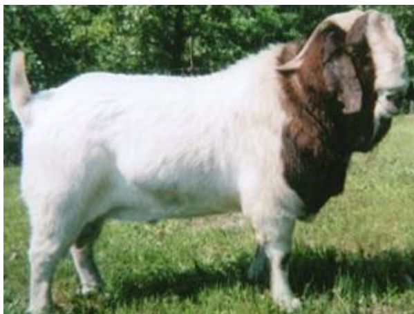
Capra sudafricana con attitudine alla produzione di carne, taglia grande mantello pezzato regolare, orecchie grandi pendenti (razza Boera)

In Italia l'attitudine prevalente è alla produzione di latte. Nel mondo esistono poche razze con propensione spiccata per la carne (ad esempio, razza Boera del Sud Africa)