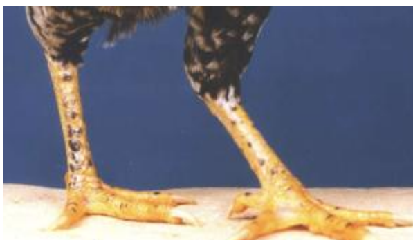
Tarso liscio, giallo maculato di nero (razza Ancona)