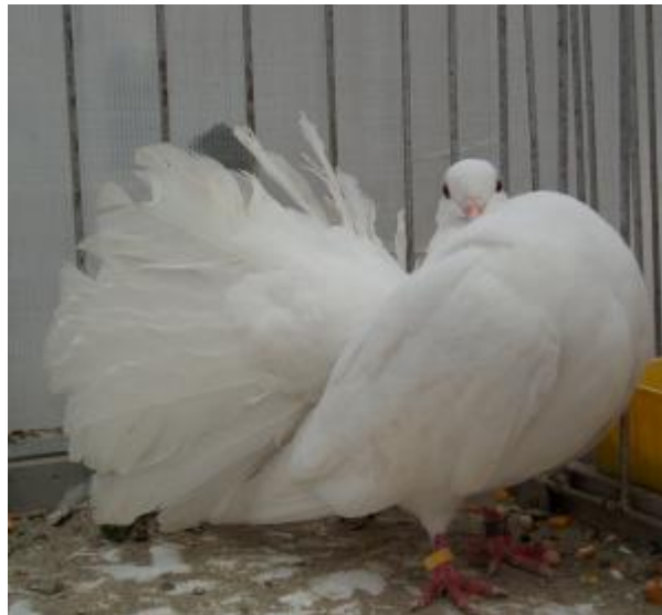
Colombo di taglia media a portamento eretto, monocolore con coda a ventaglio (razza Pavoncella)