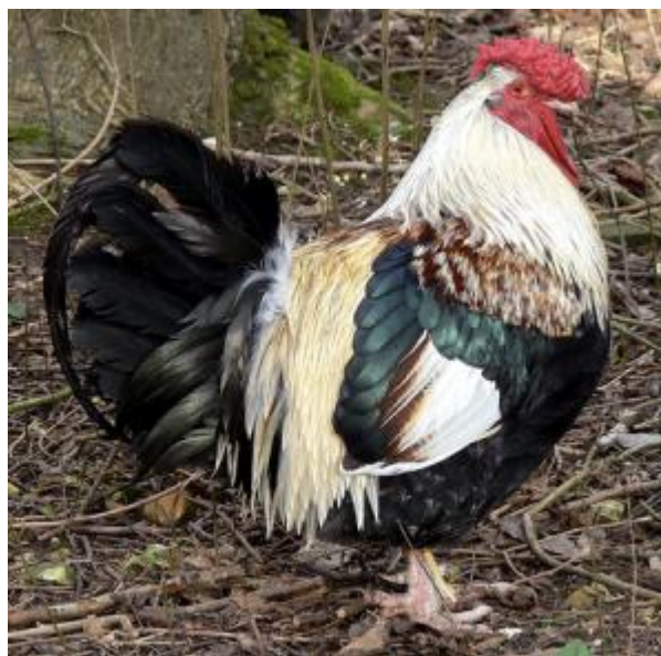
Gallo di taglia grande, portamento orizzontale, livrea con disegno complesso, pentadattila, cresta a rosa con spina che segue la nuca (razza Dorking)