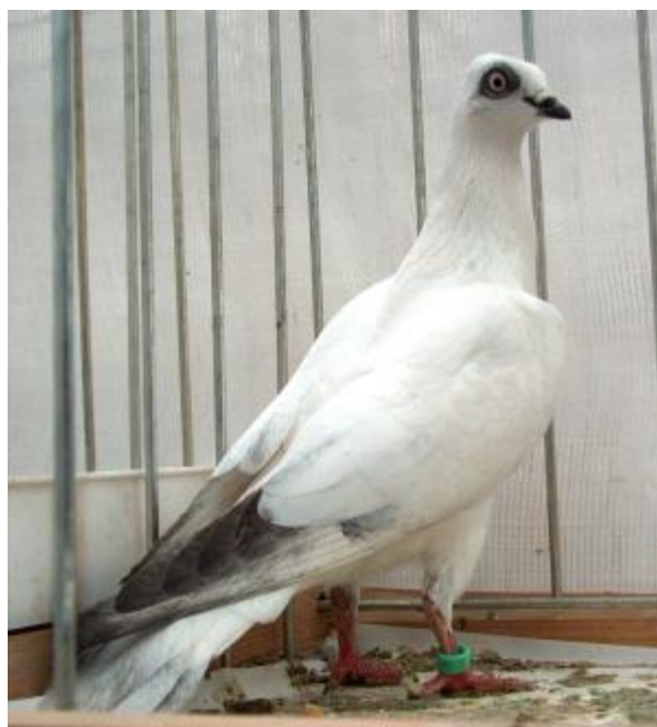
Colombo di taglia piccola, con profilo della fronte spigoloso, occhio perlato, mantello cicognetta (razza Cicognetta)