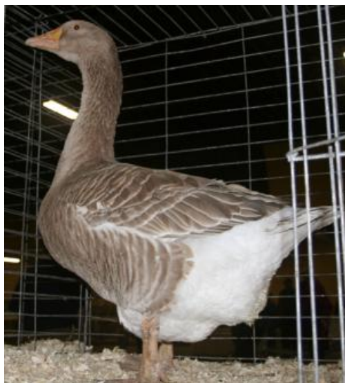
Oca di ceppo Anser, taglia grande, monocolore, becco aranciato (razza Americana Fulva – Buff America)