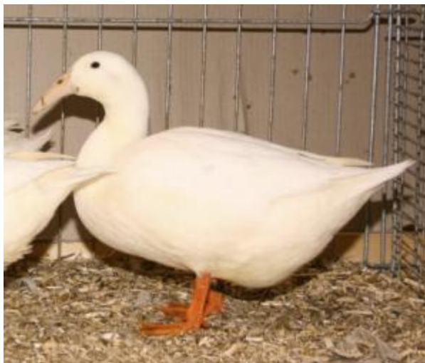
Anatra con portamento orizzontale, di taglia media, piumaggio monocolore, becco roseo, curvo, zampe aranciate (razza Curvirostra di Landsmer)

Fra le anatre domestiche, se ne trovano alcune con ciuffo occipitale di piumino (anatra ciuffata). Questo carattere è considerato letale, e non esistono omozigoti con ciuffo. La mutazione "collo nudo", presente e fissata nei polli e nei colombi, sembra essere apparsa recentemente anche in Francia. La forma del becco dell'anatra ha subito due mutazioni: una ha provocato l'estremo accorciamento dell'organo (Anatra nana), l'altra un aspetto incurvato, riscontrabile solo in un'antica razza nord-europea (Curvirostra).