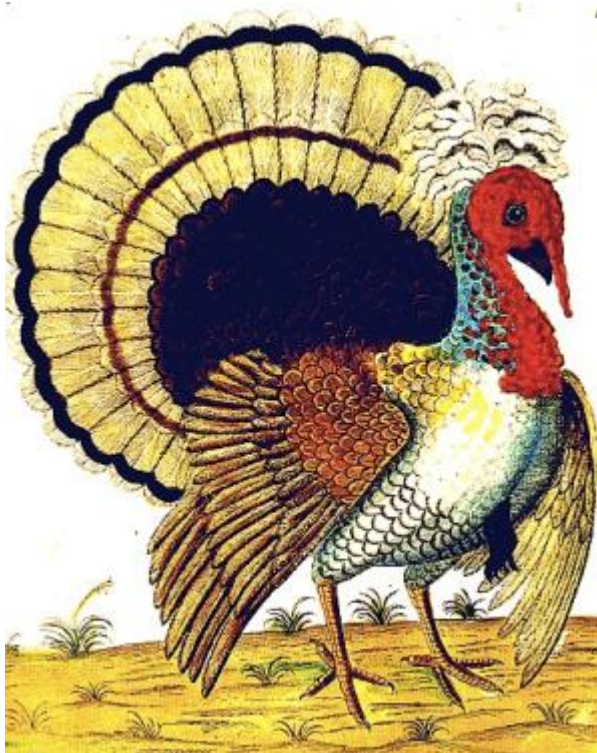
Incisione del '700 rappresentante un tacchino con ciuffo e remiganti non barrate, di razza sconosciuta

Mutazione saltuariamente presente nella specie, ma mai fissata in una razza. Il ciuffo si presenta come un pennello di piume lanose, alla sommità dell'occipite, che però non è accompagnato da ernia cerebrale della base ossea.