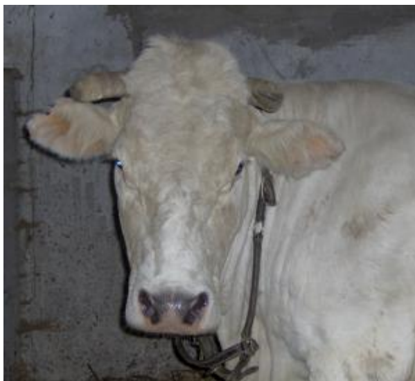
Bovina con orecchie grandi a margine arrotondato, musello bicolore (razza Modenese o Bianca Val Padana)