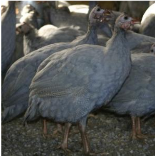
Faraona di taglia piccola, livrea monocolore a perlatura ridotta (razza Azzurra Ghigi)

Le razze allevate si differenziano quasi esclusivamente per la livrea. Nonostante le numerose mutazioni, questo carattere non è mai stato utilizzato commercialmente, e l'unica razza allevata a livello industriale è di colore grigio. La classificazione riportata è suggerita da alcuni autori americani; l'assenza di perlatura è presente solo nei ceppi statunitensi e nella Bianca albina europea.