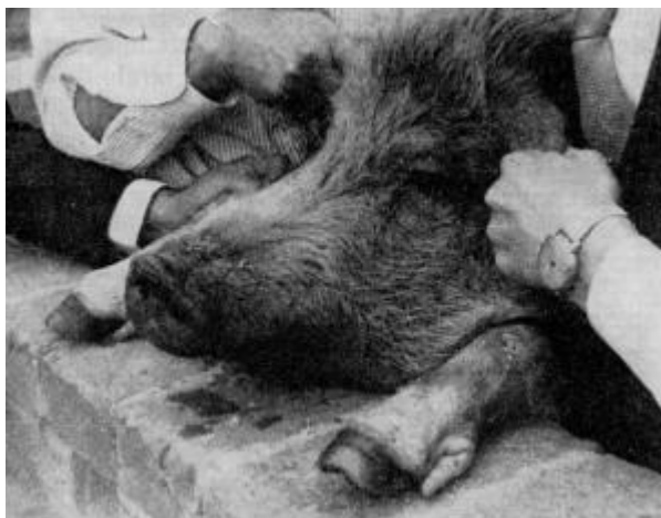
Suino sindattilo (fenomeno teratologico con rilevanza etnica) (razza Casco del Mula)

E' un descrittore correlato con il colore del mantello.