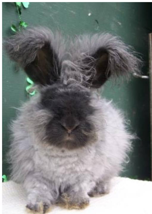
Coniglio a pelo lungo, bicolore sfumato, orecchie con portamento eretto (razza Angora)