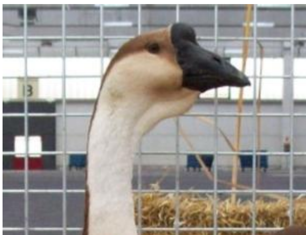
Oca con giogaia e tubercolo frontale (razza Africana)

La mutazione "ciuffo" non è mai stata presa in considerazione per la selezione di "razze ciuffate"; compare solo saltuariamente nelle popolazioni di oche comuni, ed è una caratteristica apprezzata nella razza Roman (oca di Roma) ed Empordanesa.