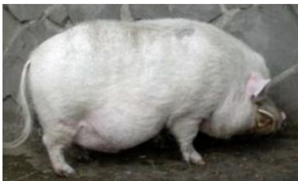
Suino di taglia piccola, di tipo adiposo, mantello monocolore, orecchie erette (razza Miniatur swine)