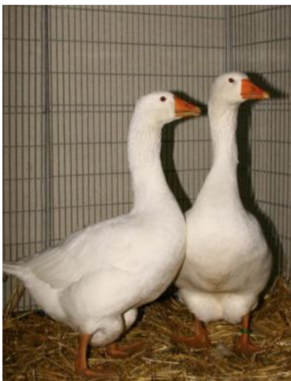
Oca di taglia grande, monocolore, con sacche ventrali doppie (razza Deutsche Lagenganse)

Nella regione ventrale può esistere un grosso deposito di grasso, detto "fanone", che può presentarsi sotto forma di una sacca semplice oppure divisa in due formazioni rotondeggianti (sacche ventrali) che, nell'oca ingrassata, quasi sfiorano terra. La presenza del fanone è generalmente influenzata anche dal sesso e dallo stato fisiologico dell'animale (aumenta nelle femmine in deposizione).