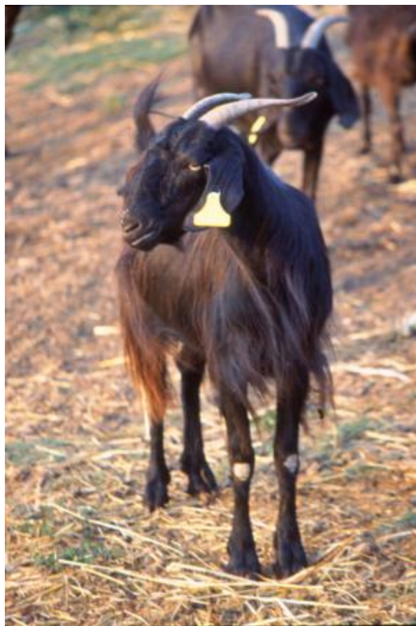
Capra mediterranea con orecchie pendenti, profilo fronto-nasale convesso, corna a falchetta divergenti (capra Napoletana)

Esistono pochissime razze la cui incornatura differisce marcatamente da quanto elencato. L'assenza di corna in un individuo può coesistere con la presenza nella popolazione, oppure essere tipica di una razza, avendo quindi valenza alterna come descrittore. La valutazione delle corna deve essere fatta per maschi e femmine.