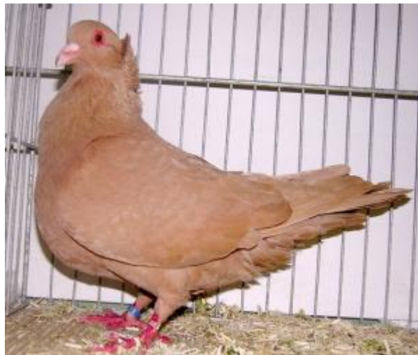
Colombo di taglia grande, monocolore, con ali lunghe, caruncole oculari, ciuffo a conchiglia (razza Sottobanca Modenese)