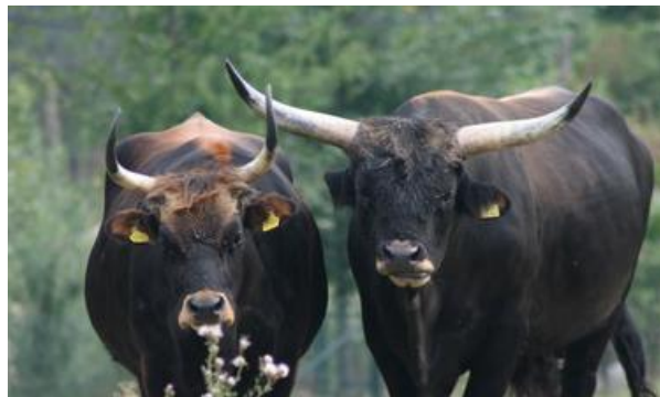
Dimorfismo sessuale delle corna; punte divergenti, dirette in alto e in avanti, nere (Uro ricostituito)