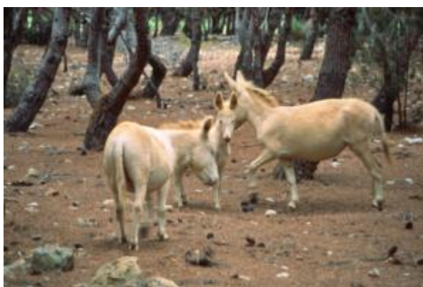
Asino di taglia piccola, mantello monocolore a pelo raso (razza Asinara)

I mantelli più comuni riscontrabili nella specie asinina sono il grigio sorcino ed il baio; tuttavia non mancano esempi di mantelli insoliti, quali il morello zaino, il sauro, il grigio pomellato ed altri. Pur rivestendo importanza etnica, il colore del mantello non è sempre indicato ad esprimere valutazioni etnologiche e molte razze presentano estrema variabilità per questo carattere.