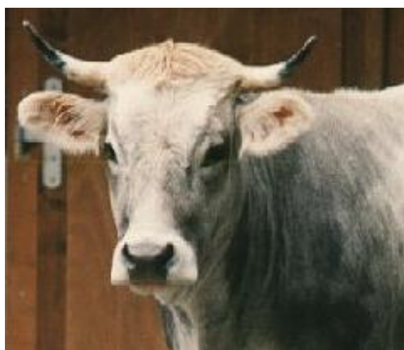
Bovina con orecchie medie, orizzontali e con apice arrotondato, corna bicolori con apice nero (razza Grigia Retica)

L'apprezzamento dimensionale dell'intero padiglione auricolare permette importanti valutazioni di tipo etnico. Numerose razze europee presentano padiglioni auricolari con portamento orizzontale, mentre molte razze zebuine li hanno pendenti, molto lunghi e con apice appuntito a forma di lancia (zebù indiani ed africani). Oltre ai parametri sopra indicati, è buona norma valutare e prendere nota anche della copertura e della lunghezza del pelo sul margine libero del padiglione auricolare.