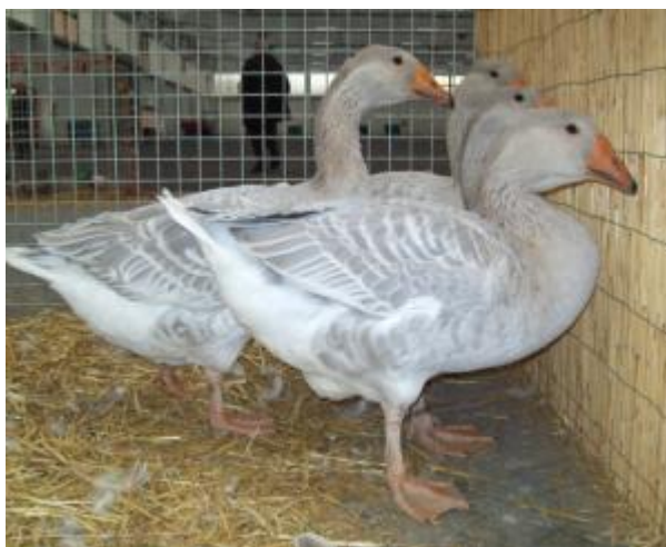
Oca di taglia media, Anser x Cignoides, becco aranciato unghiato nero (razza di Celler)

Due diverse specie vengono considerate oggetto di domesticazione. Esiste un certo numero di razze di origine ibrida fra le due specie. Questi ibridi risultano tuttavia completamente fecondi, e danno vita ad individui con caratteri intermedi fra le due.