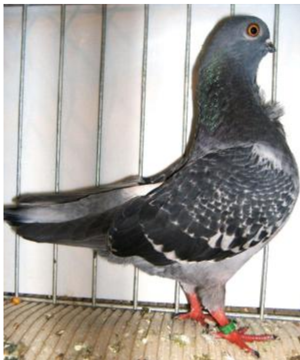
Colombo di taglia piccola, mantello martellato, con cravatta, testa sferica, occhio di gallo, becco corto (razza Reggianino)