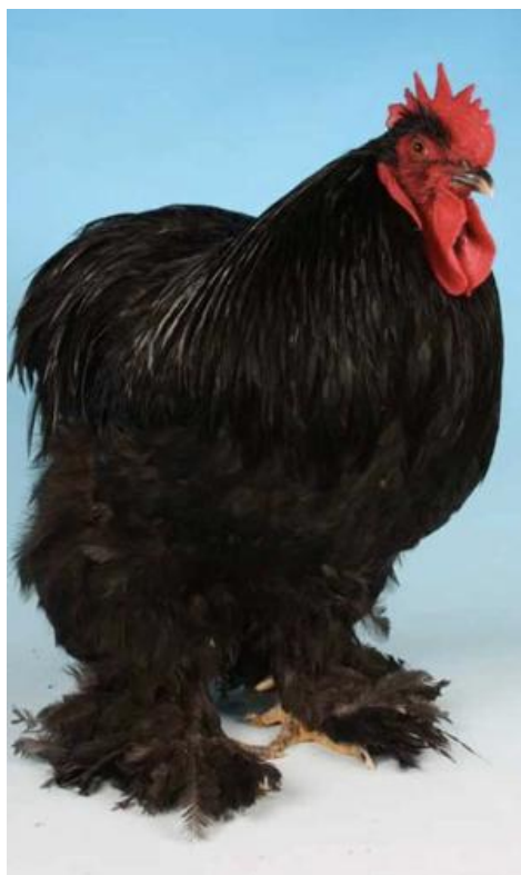
Gallo di taglia grande, eterosoma, monocolore con tarsi calzati, cresta semplice, orecchioni rossi (razza Cocincina)