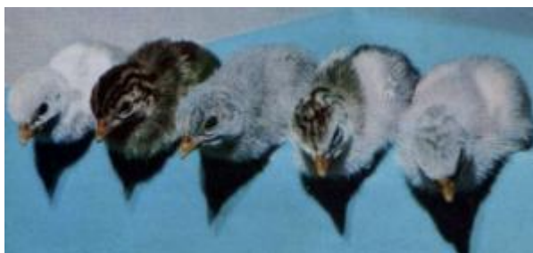
Pulcini di faraona (da sx a dx): monocolore senza strie, strie longitudinali (2 ess.), strie ondulate (2 ess.)

Il colore del pulcino è fortemente correlato con quello dell'adulto.