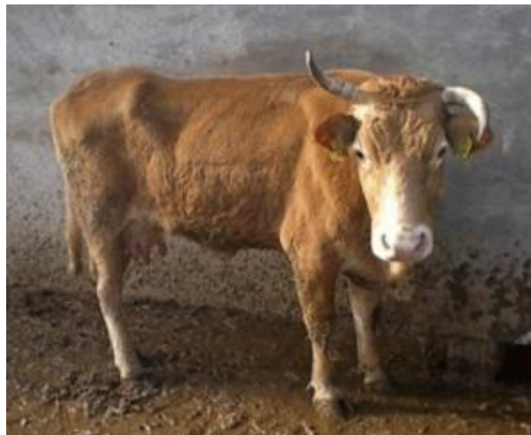
Corna asimmetriche per cause accidentali, non utilizzabili nell'inquadramento etnico dell'esemplare (bovina Varzese-Ottonese-Tortonese)

Le corna dei bovini rappresentano un descrittore importante, in grado di inquadrare molto precisamente alcune razze. Attacco nel sincipite, direzione, sviluppo, colorazione e simmetria delle stesse variano notevolmente per caratteri legati al sesso, pertanto è opportuno eseguire la