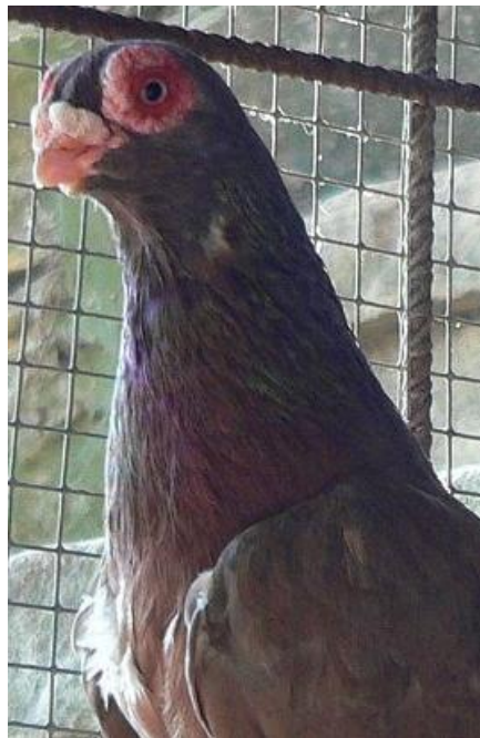
Colombo di taglia piccola, monocolore, con caruncole oculari multiple, becco corto con caruncola nasale mediamente sviluppata (razza Indiana)