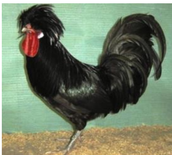
Gallo eterosomo, testa con ciuffo espanso, orecchioni bianchi, tarsi grigio piombo (razza Ciuffata Olandese)

Il ciuffo può avere come base anatomica una vistosa anomalia, costituita da un'ernia cerebrale, oppure esserne priva. Esistono inoltre ciuffi che originano dalla nuca a mo' di criniera. La