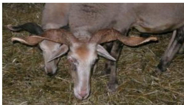
Pecora con corna elicoidali aperte, orecchie orizzontali (razza Modenese – Balestra)

Esistono pochissime razze la cui incornatura differisce marcatamente da quanto elencato. L'assenza di corna in un individuo può coesistere con la presenza nella popolazione, oppure essere