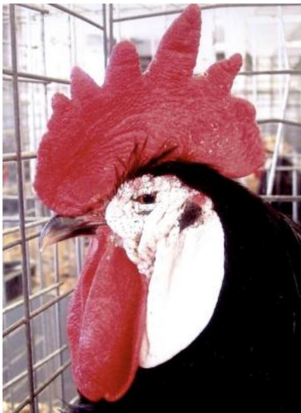
Gallo con cresta semplice grande, bargigli grandi, orecchioni grandi e faccia bianca (razza Spagnola a faccia bianca)

Gli orecchioni sono di grande ausilio nella differenziazione fra razze mediterranee ed asiatiche. Anche nel Gallus gallus selvatico esistono varietà con orecchioni di diversa pigmentazione. L'orecchione bianco è tipico delle razze mediterranee, e trova il suo massimo sviluppo nella razza Spagnola a faccia bianca, dove la pigmentazione dell'intera testa è bianca, ad esclusione di cresta e bargigli. Nelle razze asiatiche eterosome, l'orecchione è invariabilmente rosso, come pure in molte razze americane derivate dalle asiatiche. Vi sono anche razze con orecchioni bianco bluastrò.