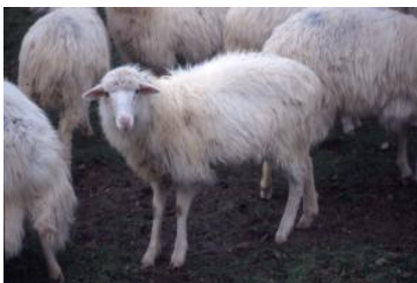
Pecora con vello aperto, monocolore, orecchie piccole orizzontali, ciuffo frontale (razza Sarda)

Inquadra precisamente l'attitudine produttiva e la qualità della fibra.