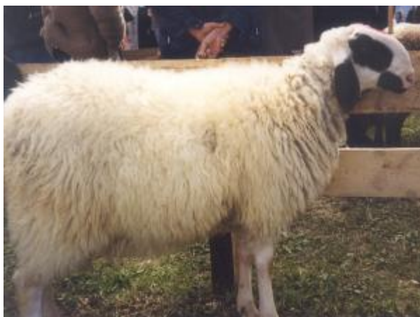
Pecora di ceppo alpino, taglia grande, profilo fronto-nasale convesso, con mantello pezzature regolari in corrispondenza della testa (razza Villnoesserschaf)