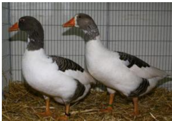
Oca di piccola taglia, ceppo Anser, priva di fanone, livrea pezzata (razza Alsazia)