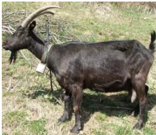
Capra di ceppo alpino con mantello monocolore a pelo raso; corna alpine a punte divergenti (razza Verzasca)

Pur non essendo sempre facile esprimere un giudizio sul ceppo di appartenenza di alcune razze, convenzionalmente si è soliti parlare di razze “alpine” o “mediterranee”, dando a questo termine l’accezione di ceppo.