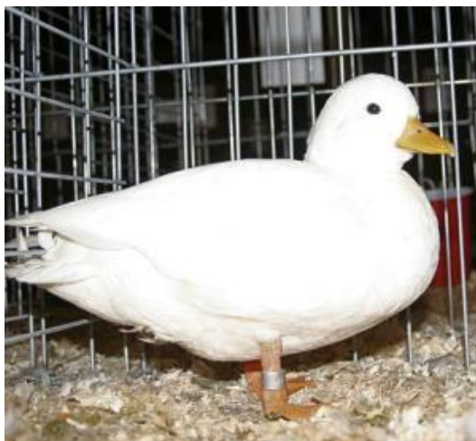
Anatra di piccole dimensioni con becco corto, occhi neri, zampe aranciate, piumaggio monocolore (razza Nana)

Esistono forti oscillazioni di mole interne alla specie. Per le razze derivate dalla Cairina esiste anche una spiccata differenza nei due sessi.