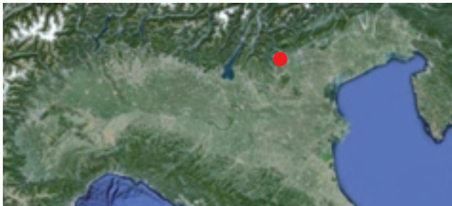
Luogo di rinvenimento della malattia in Italia.

Agli iscritti che lo richiederanno sarà rilasciato un attestato di partecipazione.