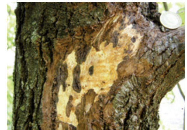
Cancro su tronco (L. Montecchio).