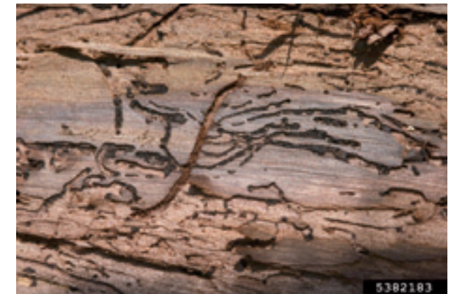
Gallerie sottocorticali (W. Cranshaw).