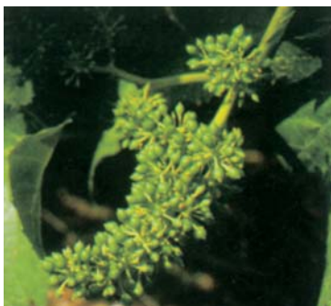
31. - K. Acini della dimensione di un piccolo pisello.