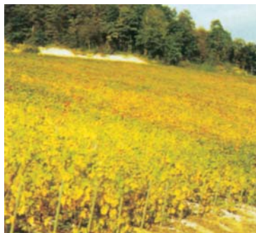
43. - O. Inizio della caduta delle foglie.