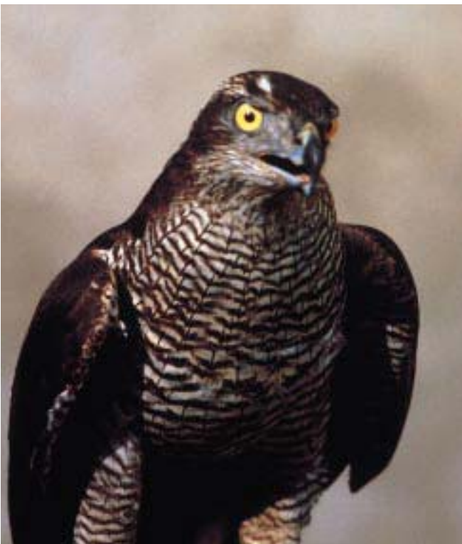
Astore ( F. Mezzavilla )