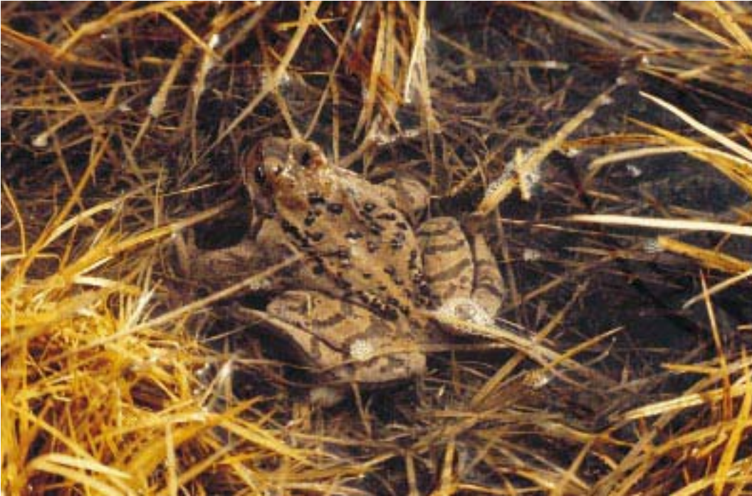
Rana rossa maschio