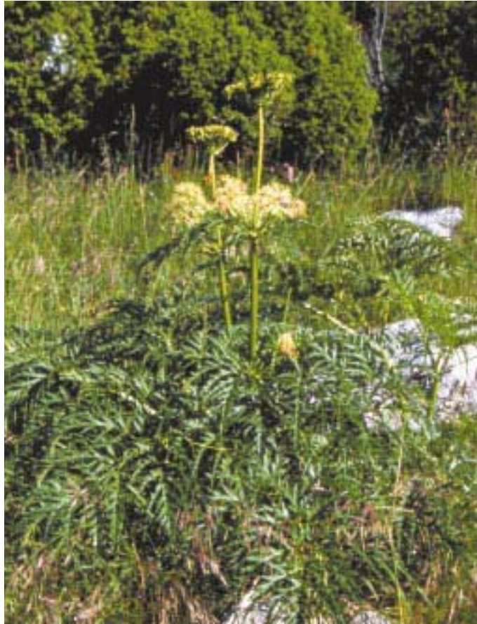
Cicutaria fetida (C. Lasen)