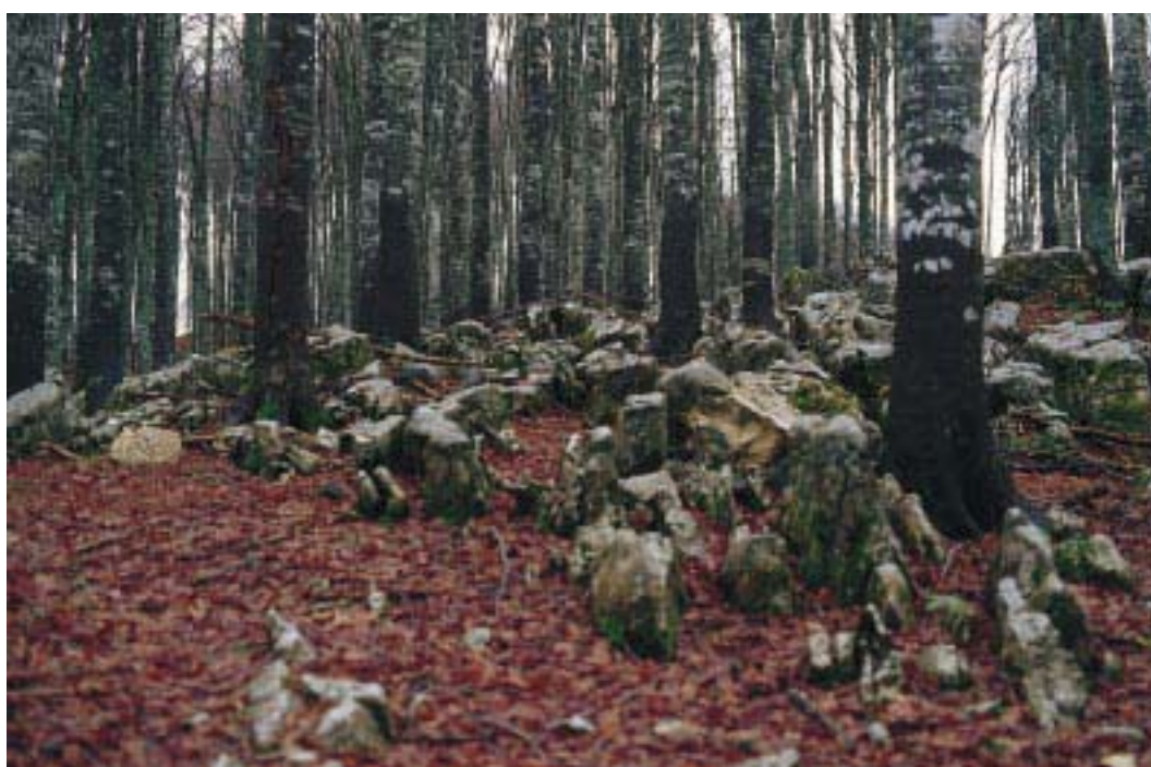
Carso a blocchi (V. Toniello)