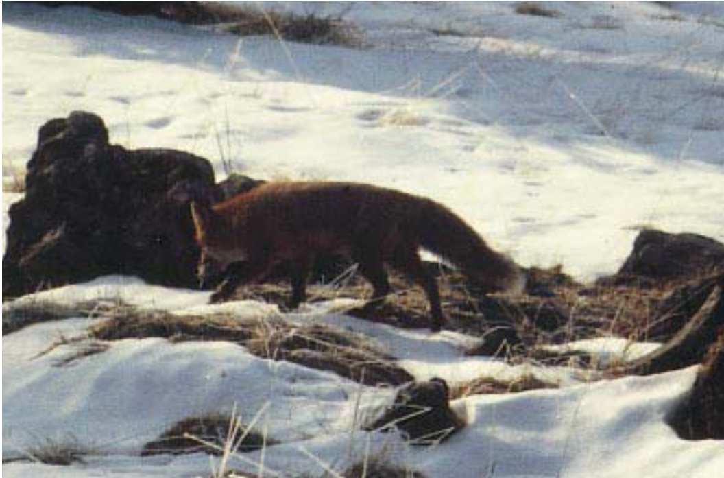
Volpe ( S. Lombardo )