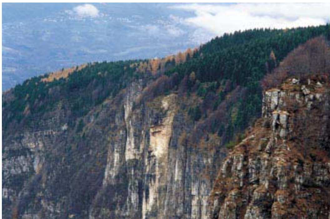
Scarpata su Val Lapisina (V. Toniello)