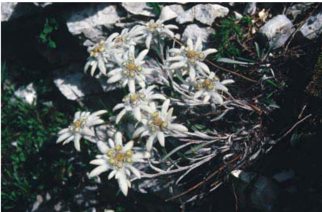
Stella Alpina (G. Paoletti)