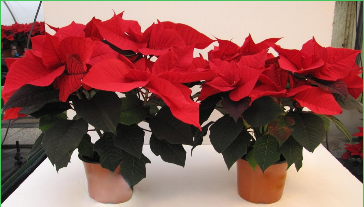
Vaso 14 Invaso sett.32