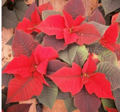
tunnel (T media)