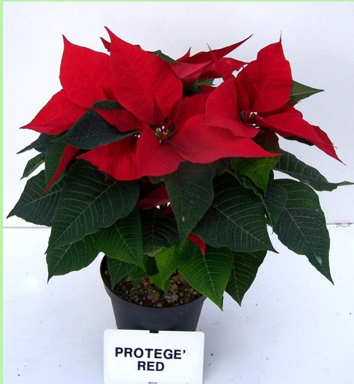
serra (T bassa)