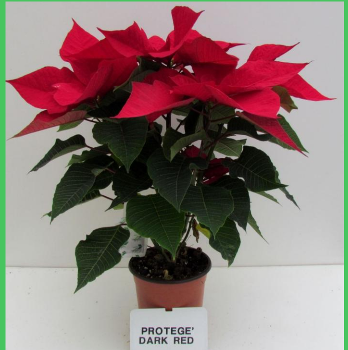
tunnel (T bassa)