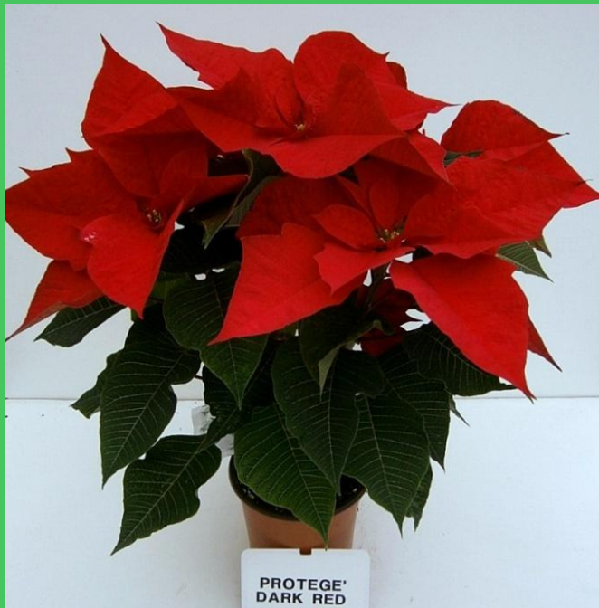
tunnel (T media)