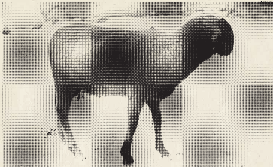
Ariete, incrocio Lamon × Meticci locali Trentini. (denominazione locale « Fiemnese »)