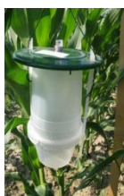
TRAP test normale