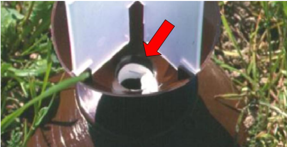
Figura2: Feromone in posizione bassa