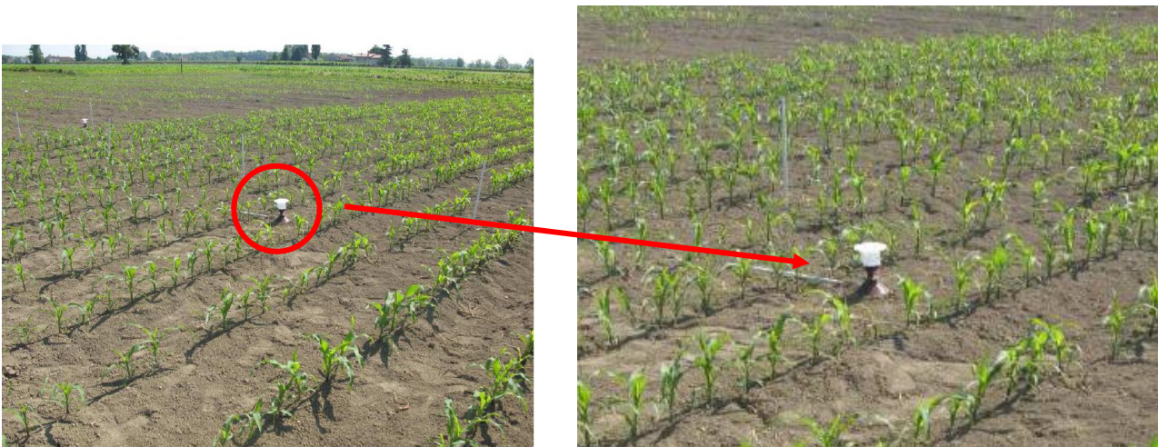
Figura5: Trappola posizionata in campo