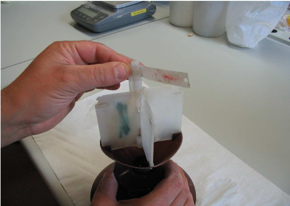
Figura4: Feromone in posizione alta