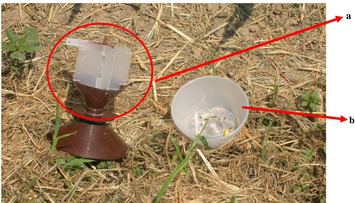
Figura1: Trappola YATLORf

4- la trappola viene riposizionata sul terreno previa accurata pulizia del fondo.