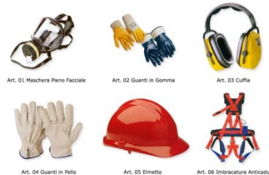
Art. 01 Maschera Pieno Facciale