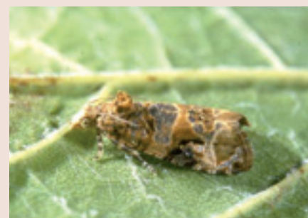
Tignoletta ( Lobesia botrana ).