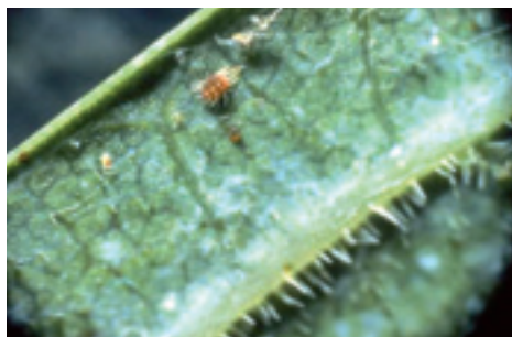
Ragnetto rosso ( Panonychus ulmi ).

Esistono anche acari utili , in quanto predatori di specie nocive . Fra questi vi sono i fitoseidi , che si nutrono dei ragnetti dei fruttiferi, della vite, e delle colture erbacee; vanno assolutamente salvaguardati in quanto sono in grado di mantenere la presenza di acari dannosi a livelli molto bassi. Vengono anche commercializzati per l'impiego in alcune coltivazioni protette.