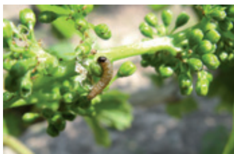
Larva di Tignola ( Eupoecilia ambiguella ).