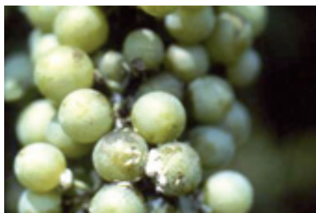
Cocciniglia farinosa ( Planococcus citri ).