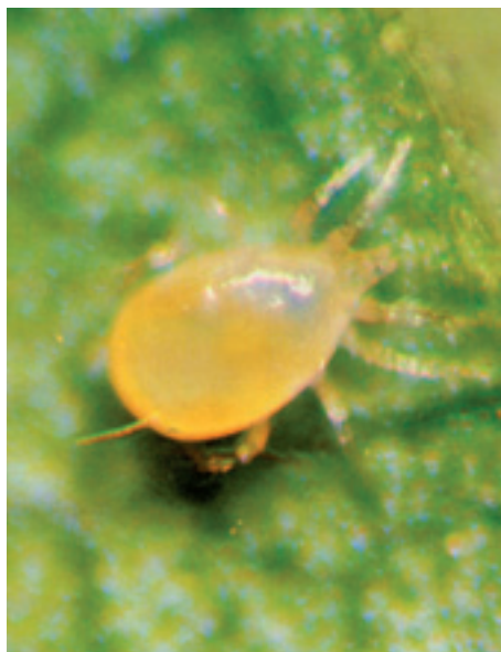
Fitoseide ( Amblyseius sp. ).