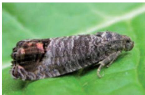
Carpocapsa ( Cydia pomonella ).