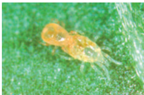
Fitoseide ( Typhlodromus sp. ).