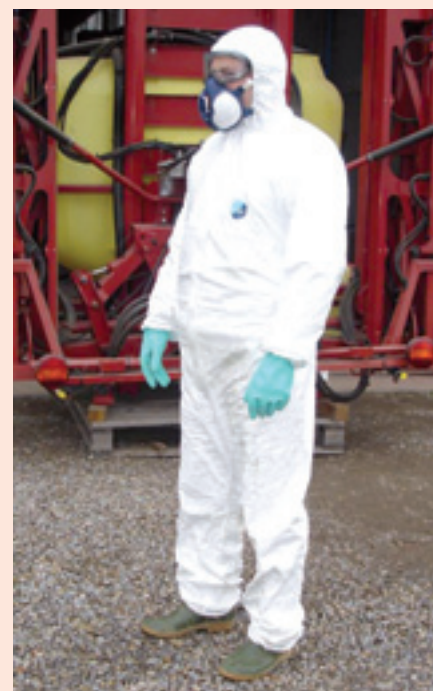
Operatore equipaggiato con tutti i Dispositivi di Protezione Individuale necessari per un trattamento fitosanitario.