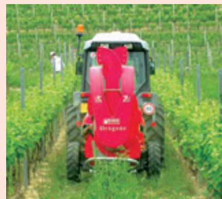
Trattore con cabina pressurizzata.