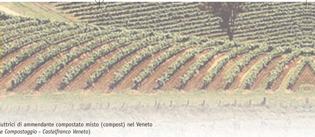
Tab. 18 - Elenco delle ditte produttrici di ammendante compostato misto (compost) nel Veneto (da ARPAV, Osservatorio Regionale Compostaggio - Castelfranco Veneto)