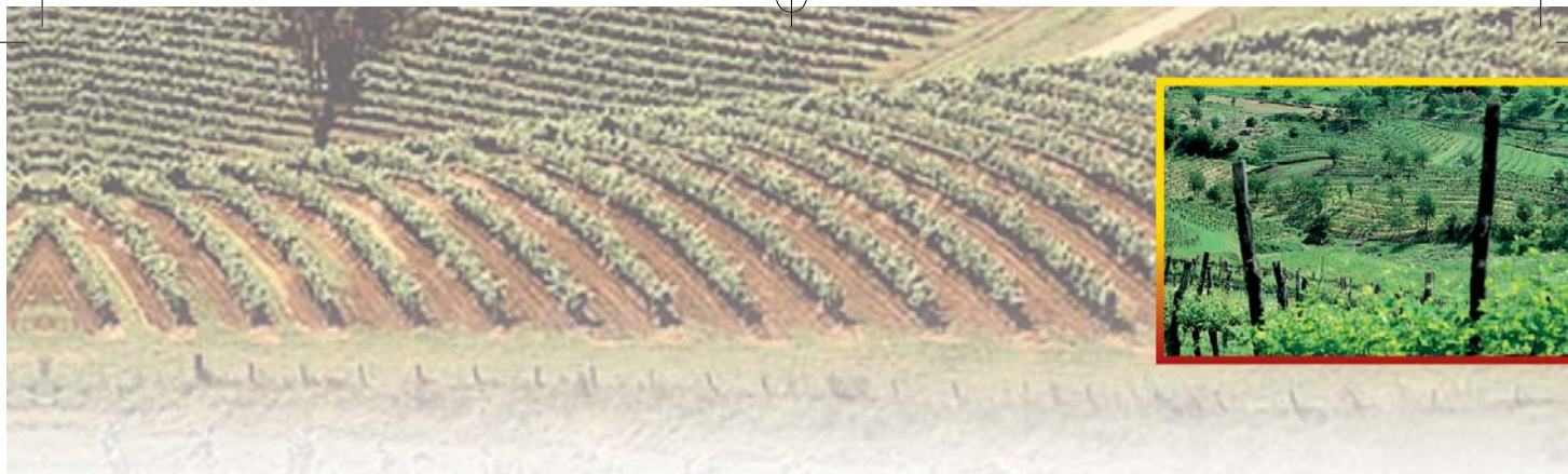
Tab 16 - Concimi organici utilizzabili nella concimazione di produzione