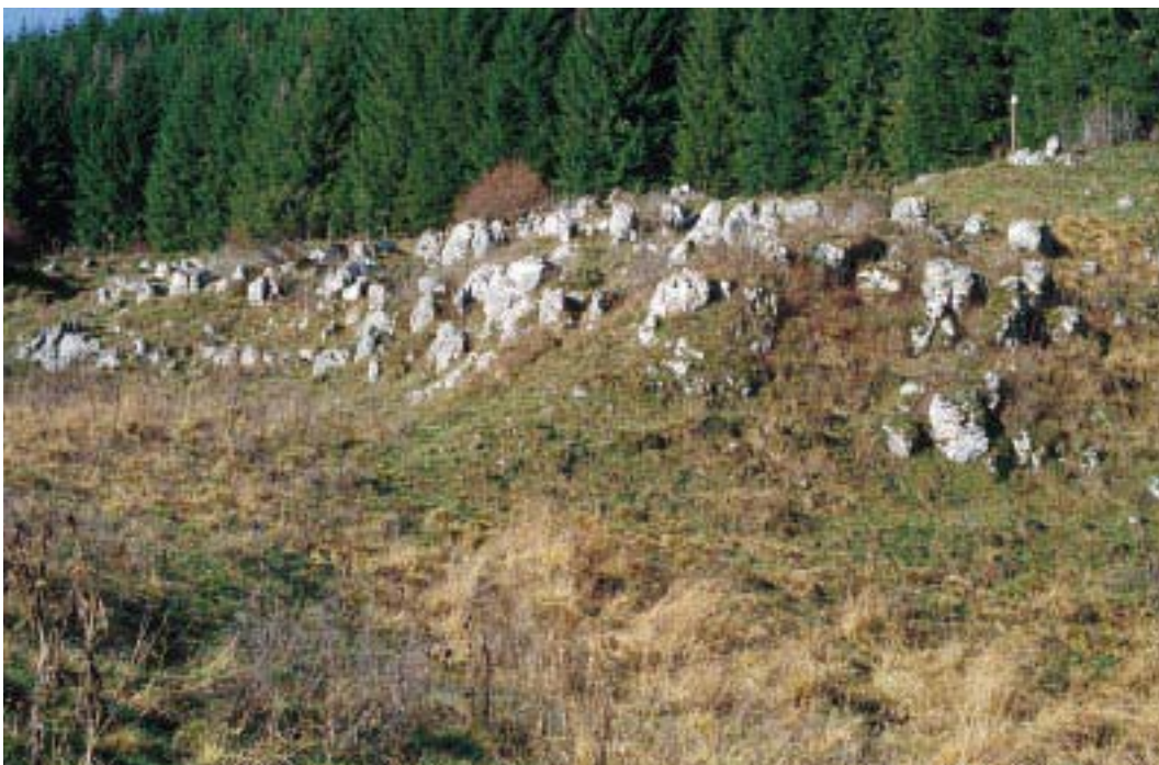
Carso a blocchi (V. Toniello)