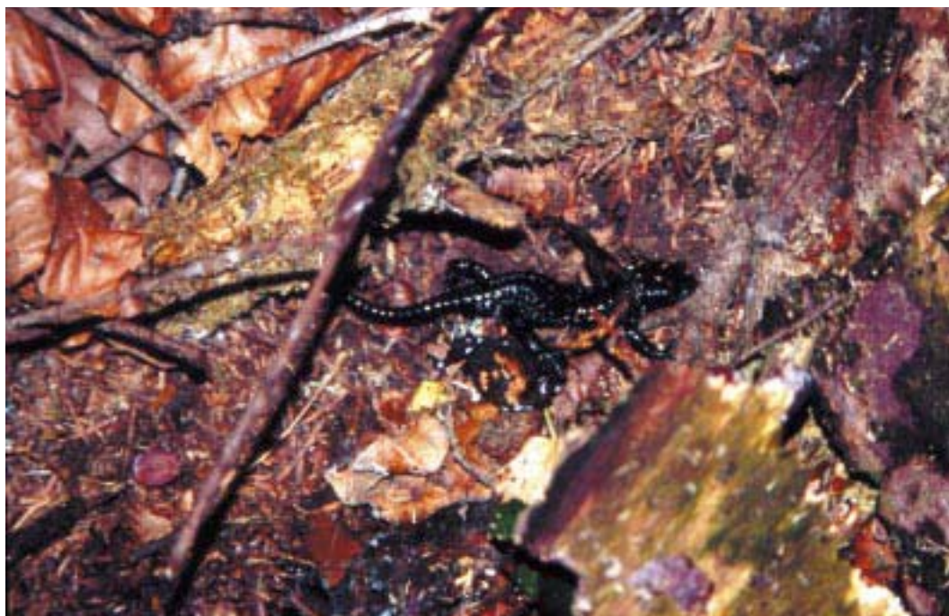
Salamandra nera (C. Lasen)