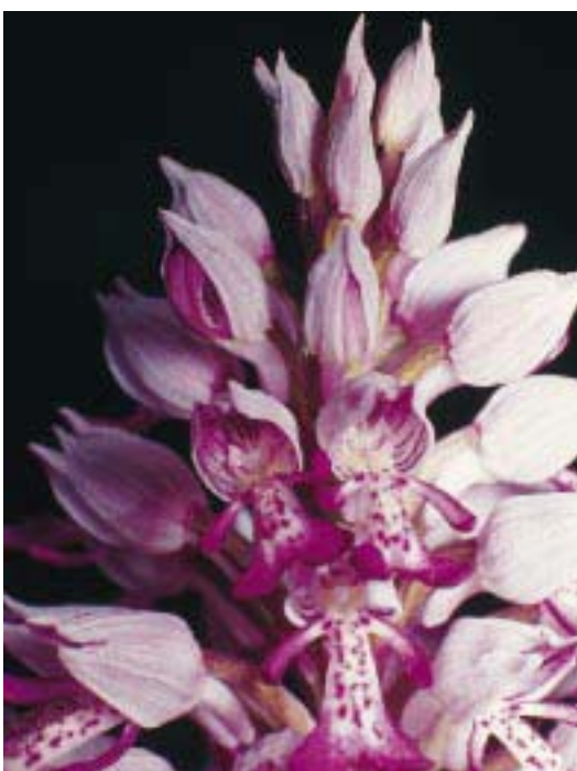
Orchidea militare (S. Vicenzi)