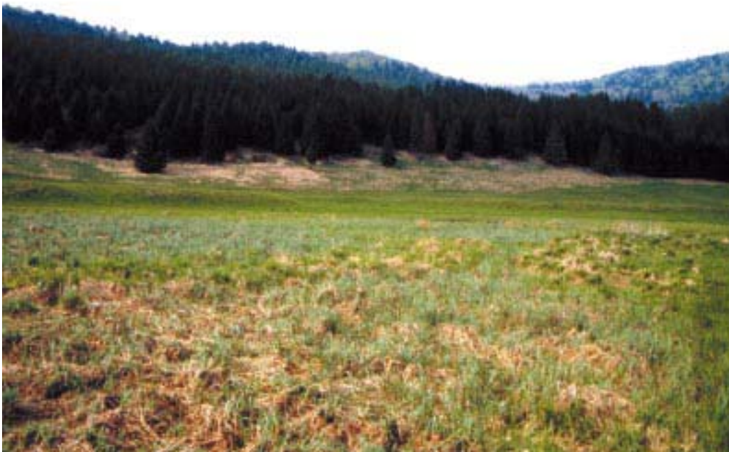
Carex rostrata (C. Lasen)