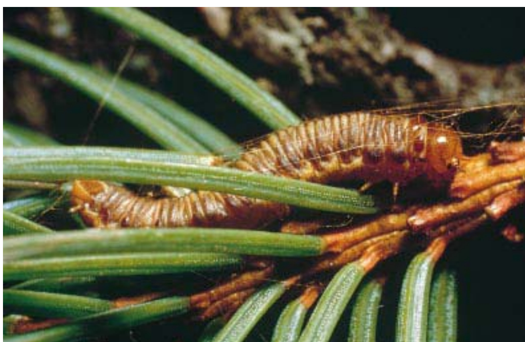
Cephalcia arvensis