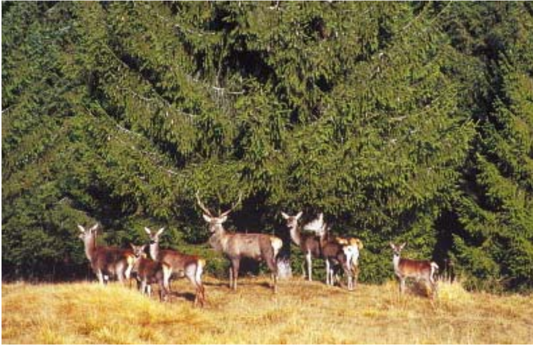
Cervi (V. de Savognani)