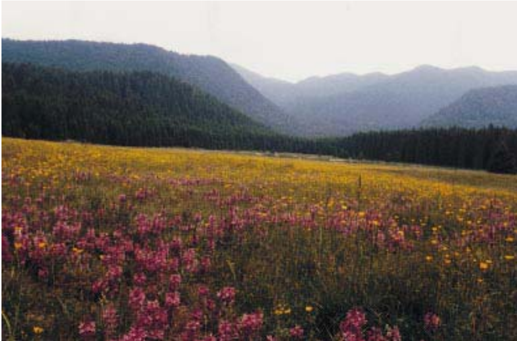
Pascolo di Valmenera (S. Lombardo)