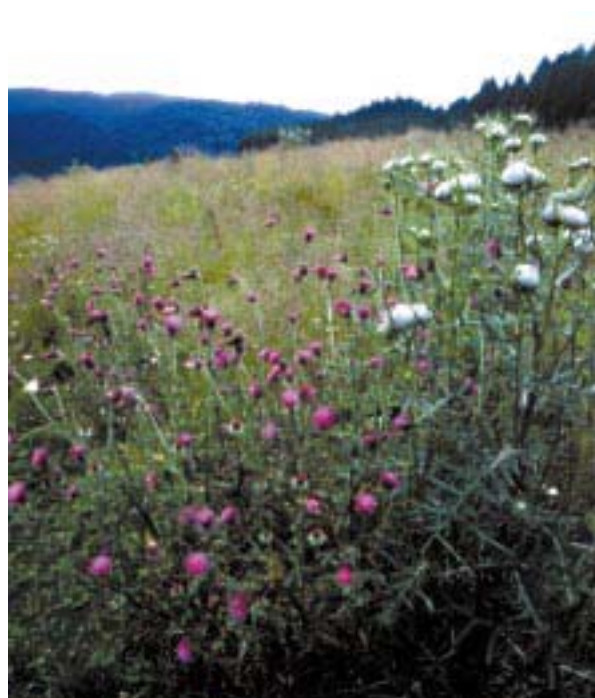
Cirsio scardaccio e Carduus ( C. Lasen )