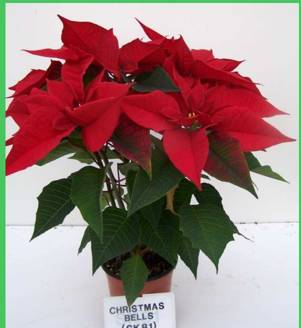
tunnel (T bassa)