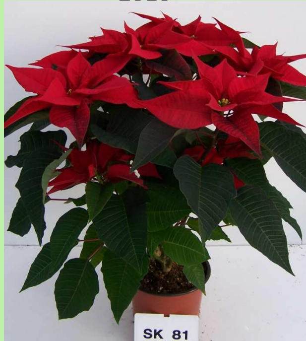
serra (T media)