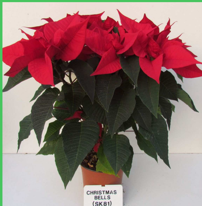
serra (T media)