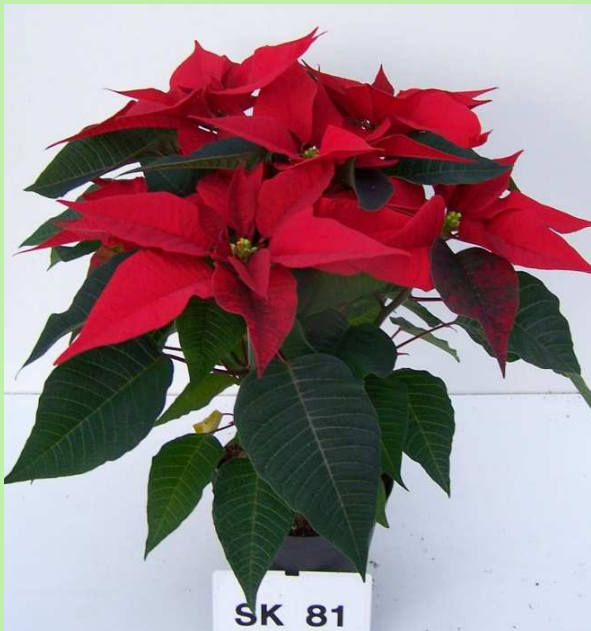
serra (T bassa)