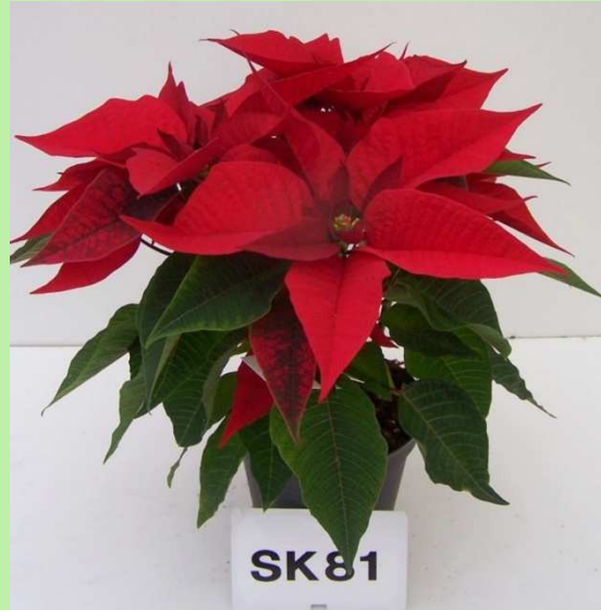
tunnel (T bassa)