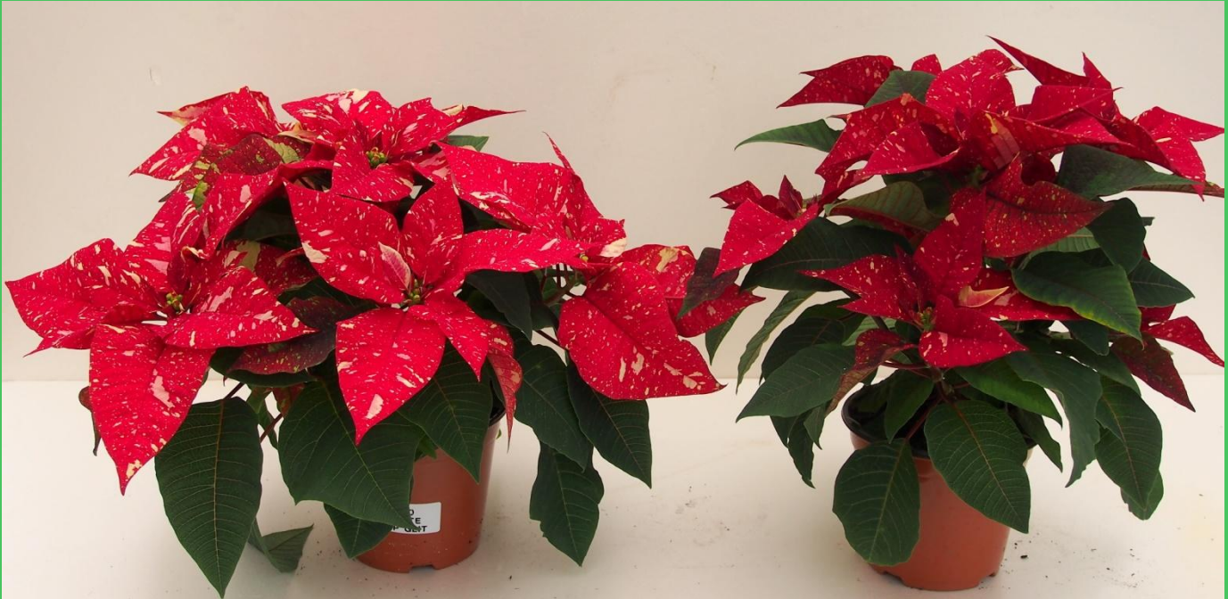
Serra T media