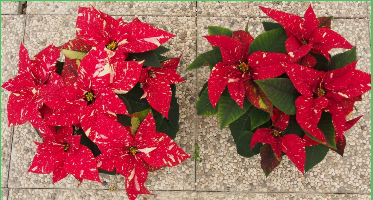
Tunnel T bassa