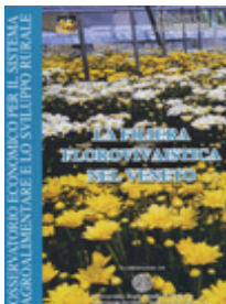
La filiera florovivaistica del Veneto AA.VV. (2002) - libro [cod. SC36]