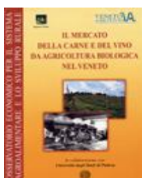
Il mercato della carne e del vino da agricoltura biologica nel Veneto AA.VV. (2002) - libro [cod. SC33]