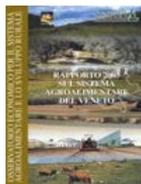
Rapporto 2003 sul sistema agroalimentare del Veneto AA.VV. (2004) - libro [cod. E9]