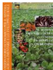
Il sistema ortofrutticolo veneto: un modello in evoluzione AA.VV. (2002) - libro [cod. SC34]