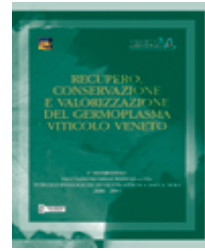
Recupero, conservazione e valorizzazione del germoplasma viticolo veneto AA.VV. | 2004 | libro | cod. E65 |