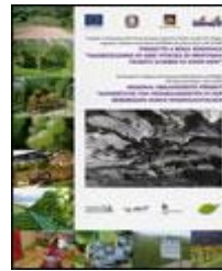
Valorizzazione di aree viticole di montagna tramite scambio di know-how – Progetto a regia regionale AA.VV. | 2008 | libro | cod. E305