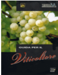
Guida per il viticoltore AA.VV. (2004) libro [cod. SC106]