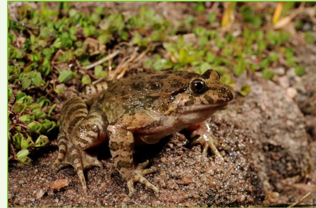
Discoglossus sardus (Discoglossa)