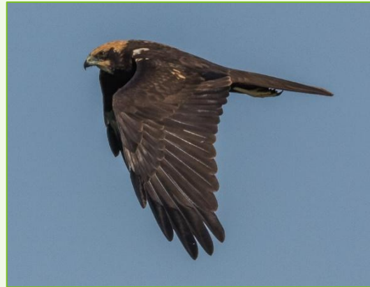
Circus aeruginosus (Falco di palude)