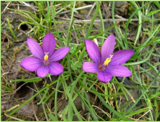
Crocus minimus (Zafferano minore)