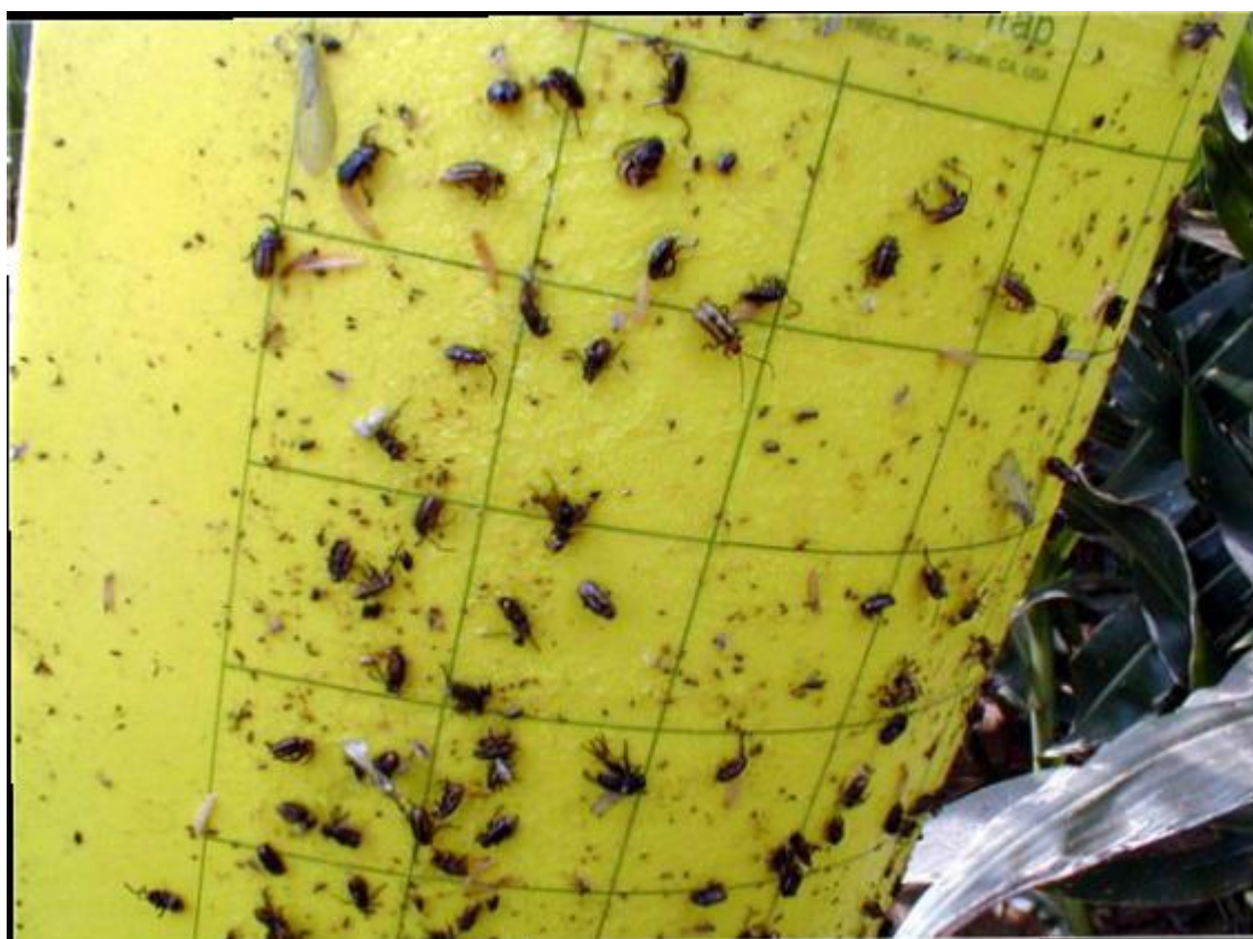
Figura 1: Trappola cromotropica adesiva