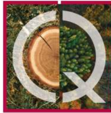
Foreste, Legno & Carta