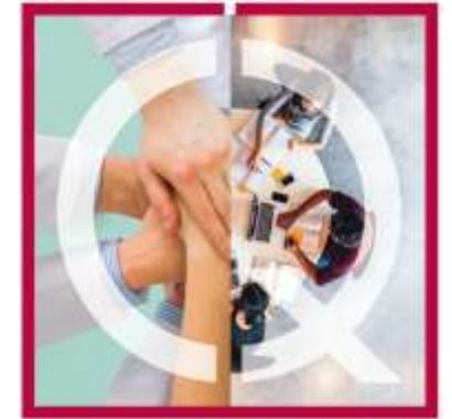
Life Sciences Sanità e Salute, Formazione e Servizi alla Persona

CERTIFICAZIONE | ASSESSMENT | ISPEZIONE | INNOVAZIONE | FORMAZIONE