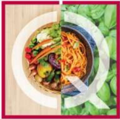
Agroalimentare e Packaging