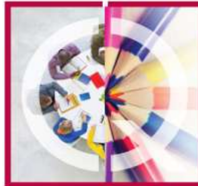
Centro Formazione Centro Formazione Scuola di Management CSQA